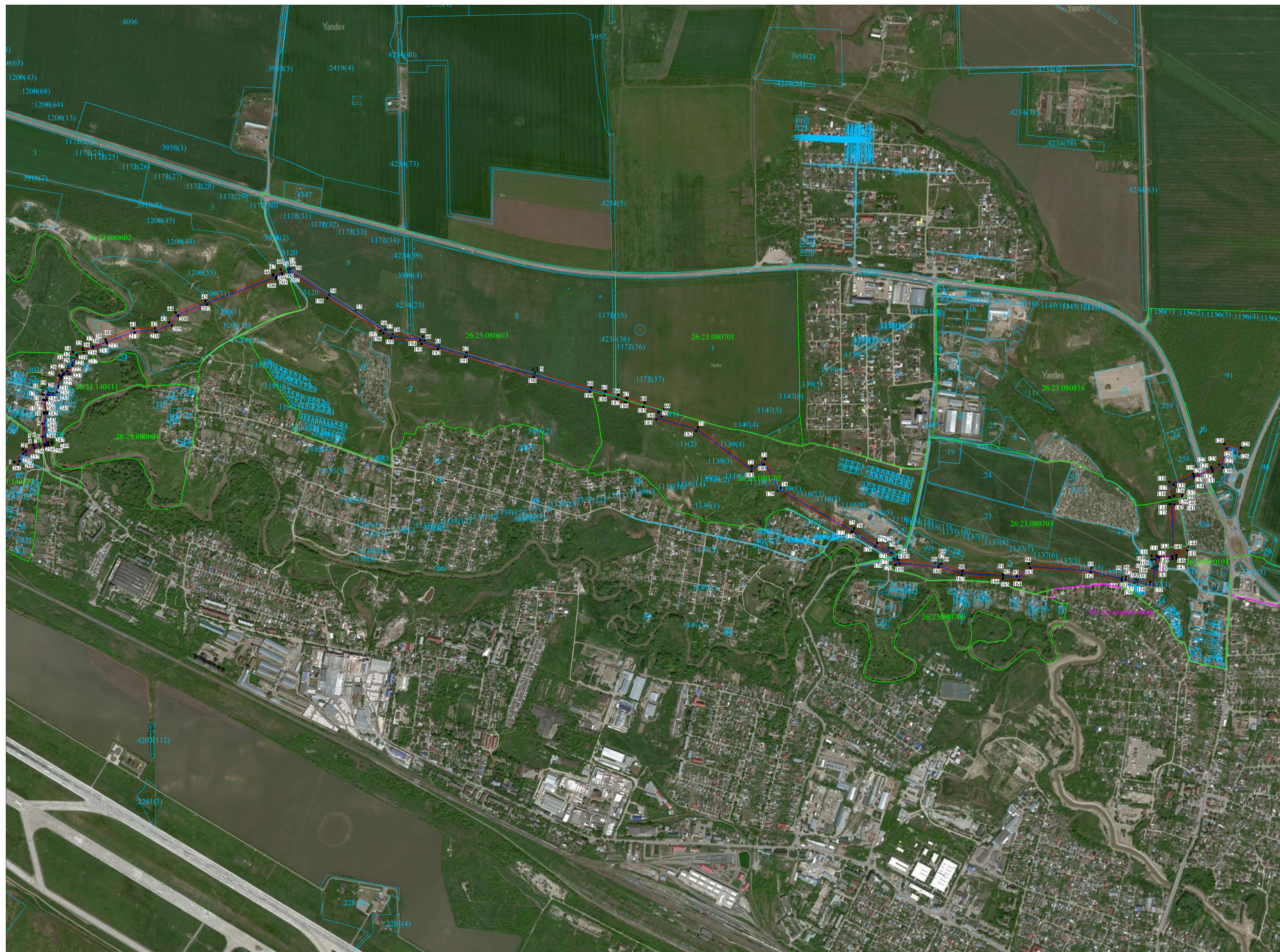
Публичная кадастровая карта Россия 2022 г.