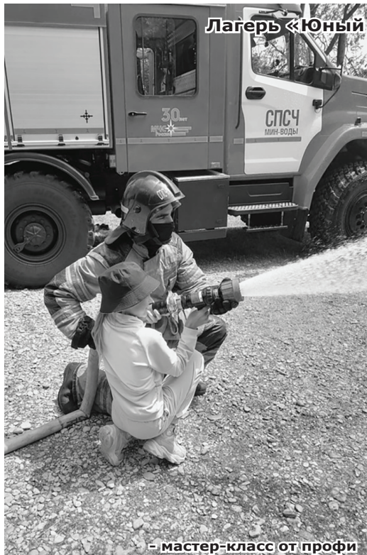
- мастер-класс от профи

Но как бы ни было весело, а отбой в лагере строго по расписанию. Воскресенье - суматошный день в «Юном патриоте». Подведение итогов, сбор вещей и т. д. Так много нужно успеть за половину дня. Время неумолимо бежит вперёд. И вот, сидя у обеденного стола,