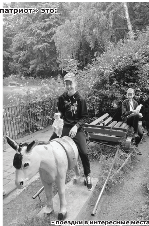
- поездки в интересные места