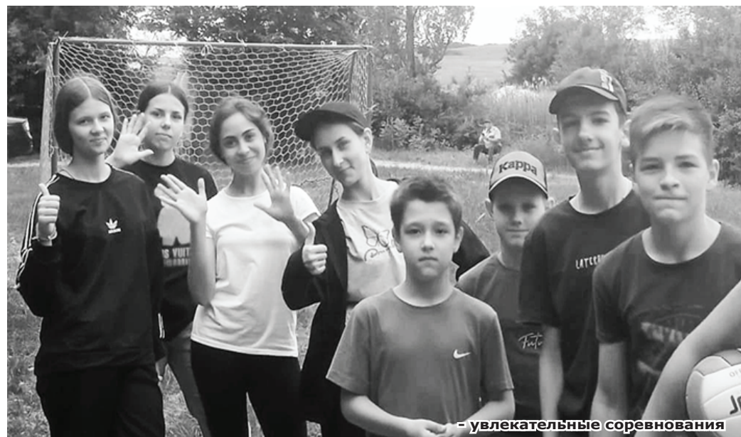
- увлекательные соревнования

дети понимают, что скоро больше не надо будет идти есть по свистку, можно спать вдоволь и самим решать, чем же занять свой досуг.