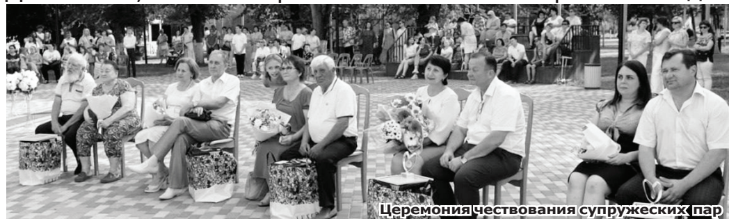
Церемония чествования супружеских пар

День семьи, любви и верности отметили в Минеральных Водах