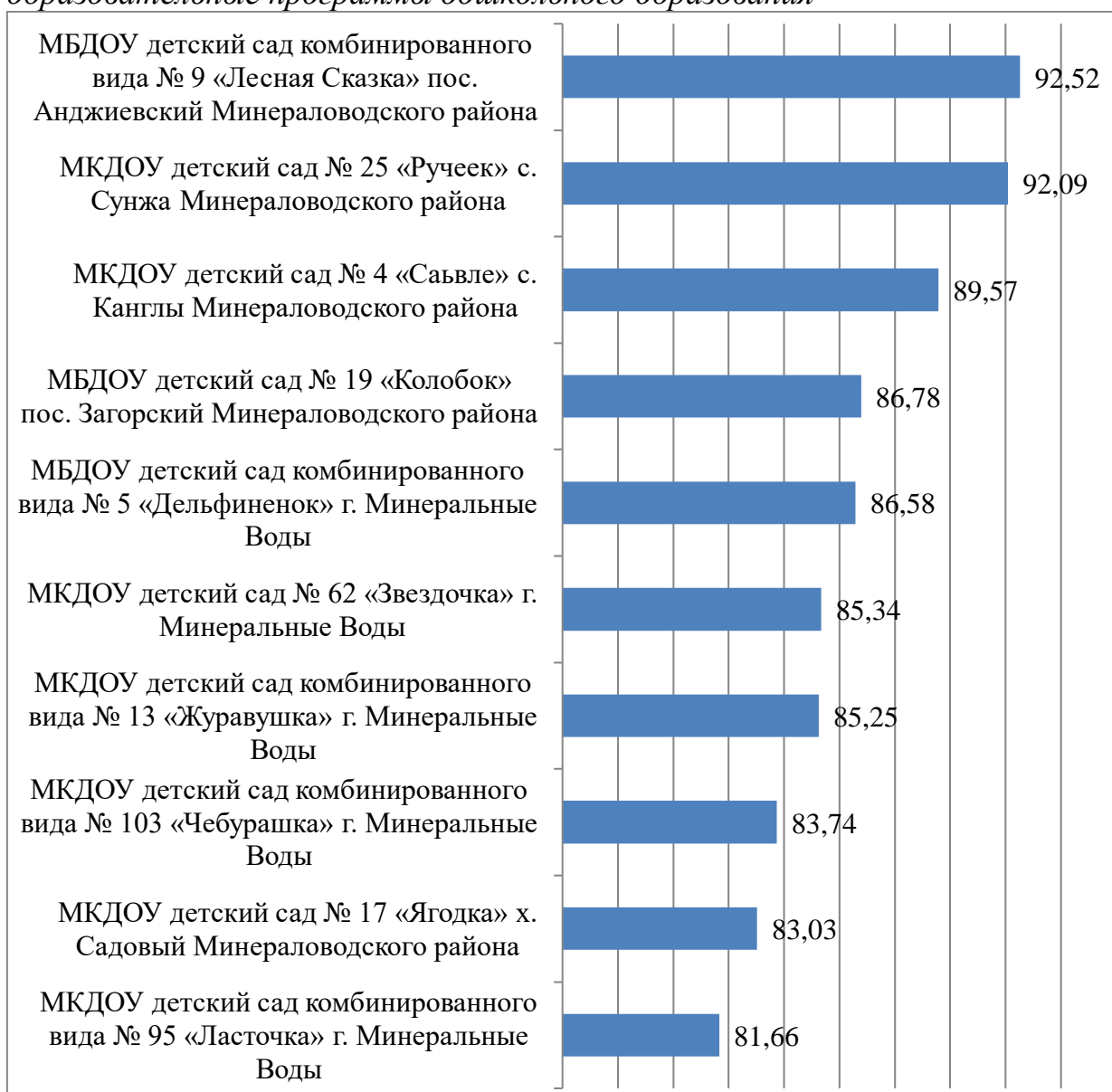
Гистограмма 1. Рейтинг по результатам сбора, обобщения и анализа информации о качестве условий оказания услуг организациями, осуществляющими образовательную деятельность на территории Минераловодского городского округа, по организациям, реализующим образовательные программы дошкольного образования