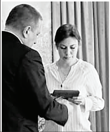
на защите Родины

Как отметил Вячеслав Сергиенко, выражая искренние слова соболезнования семье, родным и близким героя, высокая награда, к сожалению, не вернет бойца к жизни, но эта дань памяти будет служить примером беззаветного служения Родине для нынешнего и следующего поколений.