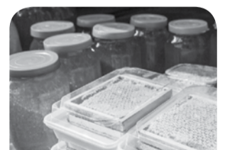
В крае насчитывается 33,5 тыс. пчелосемей

Кроме того, за последние годы в регионе для получения, переработки, фасовки и реализации продукции пчеловодства создано 3 сельскохозяйственных потребительских кооперати-