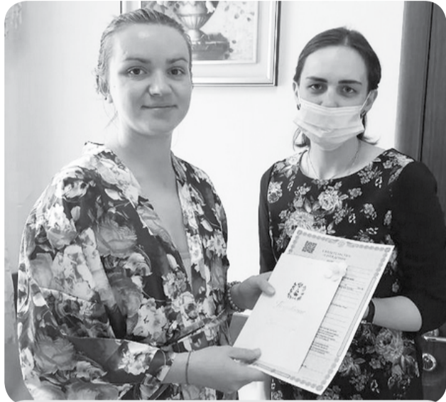
В стенах Минераловодского роддома с начала 2021 года зарегистрировано около 1000 рождений.

Счастливые мамы получили свидетельства о рождении, а также поздравительный адрес губернатора Ставрополя. Получая документ непосредственно здесь, родители освобождаются от необходимости посещения отдела ЗАГС, что очень удобно и комфортно для молодых мам.