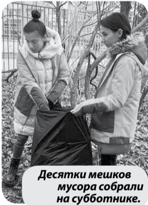
Десятки мешков мусора собрали на субботнике.

Волонтеры округа и жители второго микрорайона провели большой субботник в сквере «Дубрава».