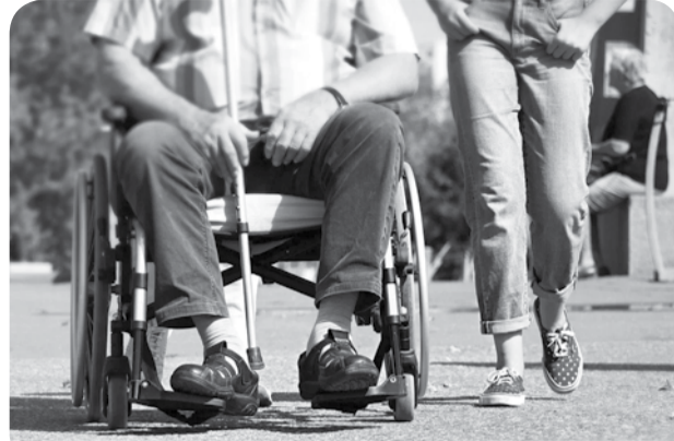
В рамках регионального проекта «Старшее поколение», реализуемого при поддержке правительства Ставропольского края, в центре уделяется большое внимание «оздоровлению старости».

Почти 5 лет в отделении функционирует «Школа