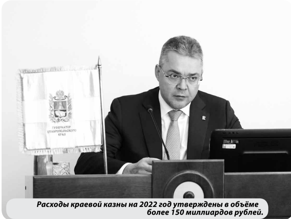
Расходы краевой казны на 2022 год утверждены в объёме более 150 миллиардов рублей.

Так, в 2022 году запланирован ввод в эксплуатацию 11 объектов образования – школ и детских садов. На организацию