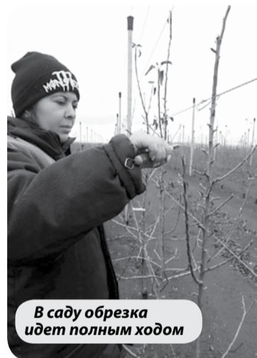
В саду обрезка идет полным ходом

реносная автономная метеостанция, которая прогнозирует погоду на неделю вперед. Подобная метеостанция является единственной в Минераловодском городском округе.