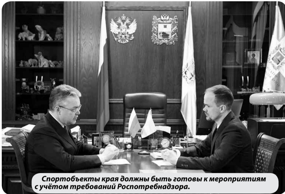
Спортобъекты края должны быть готовы к мероприятиям с учётом требований Роспотребнадзора.

Как прозвучало, ведомством совместно с Роспотребнадзором уже прорабатываются вопросы организации на Ставрополье крупных спортивных мероприятий с участием зрителей. Перечень объектов, готовых к проведению таких мероприятий с соблюдением всех необходимых требований,