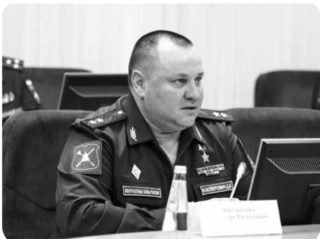
На Ставрополье работа по военно-патриотическому воспитанию молодежи будет продолжена.