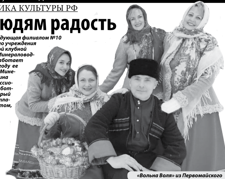
«Вольна Воля» из Первомайского

- Скажу прямо, очень нелегко решать хозяйственные вопросы, справляться с огромным потоком документации и заниматься творчеством. Но, благодаря хорошей, дружной команде