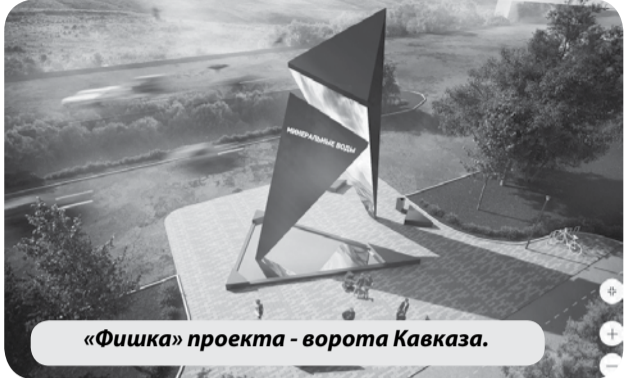
«Фишка» проекта - ворота Кавказа.

С этим проектом город планирует принять участие в конкурсе Малых городов России и исторических поселений, грант которого, в случае победы, позволит создать в Минеральных Водах еще одно благоустроенное общественное пространство.