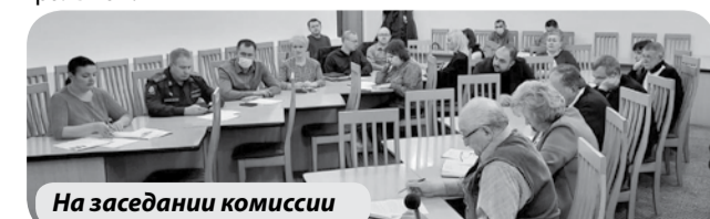
На заседании комиссии

На основании письма было назначено заседание Комиссии, где тема о статусе памятника группе «Месьть» стала центральной.