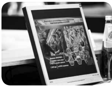
Ставрополье является лидером в России по проведению призывной кампании.

Как прозвучало, в минувшем году из-за сложившейся эпидобстановки, связанной с пандемией коронавируса, край полностью обеспечил соблюдение мер эпидбезопасности для при-