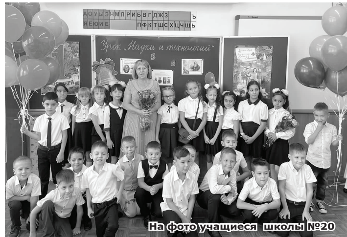
На фото учащиеся школы №20

гардероб. Что-то приобрести перед 1 сентября, а что-то — докупить в течение года, на распродажах и в интернет-магазинах, ориентироваться на текущий рост и размер ребенка.