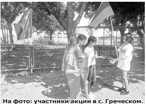
На фото: участники акции в с. Греческом.