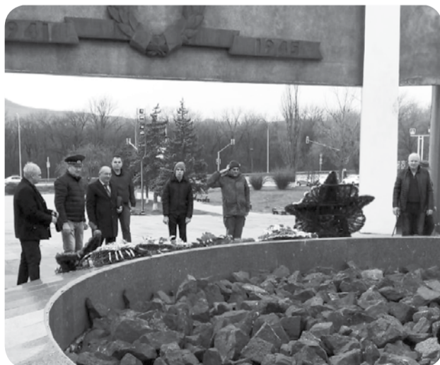
Ветераны возложили цветы к Вечному огню.

Присутствующие на мероприятии члены Минераловодских отделений общественных организаций ветеранов боевых действий, военной службы почтили память погибших защитников Родины, возложили цветы к Мемориалу «Огонь вечной славы».