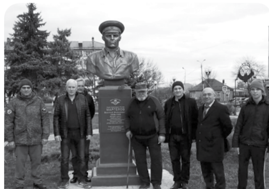
Минераловодские ветераны боевых действий и представители общественности у бюста В.Ф. Маргелова.

Рядом на площади Победы в Минеральных Водах установили бюст Василия Филипповича Маргелова – командующего Воздушно-десантными войсками (1954-1958, 1961-1979), генерала армии.