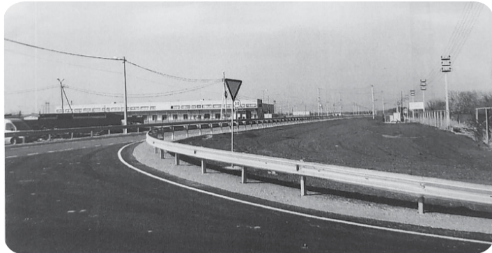
На строительство дороги к агропромышленному парку «Ставрополье» затрачено 105 млн. руб.

В Минераловодском округе введен в эксплуатацию новый участок региональной дороги Подъезд к РИП «АПП Ставрополье» от автомобильной дороги Р-217 «Кавказ». Протяженность участка – почти 2 км.