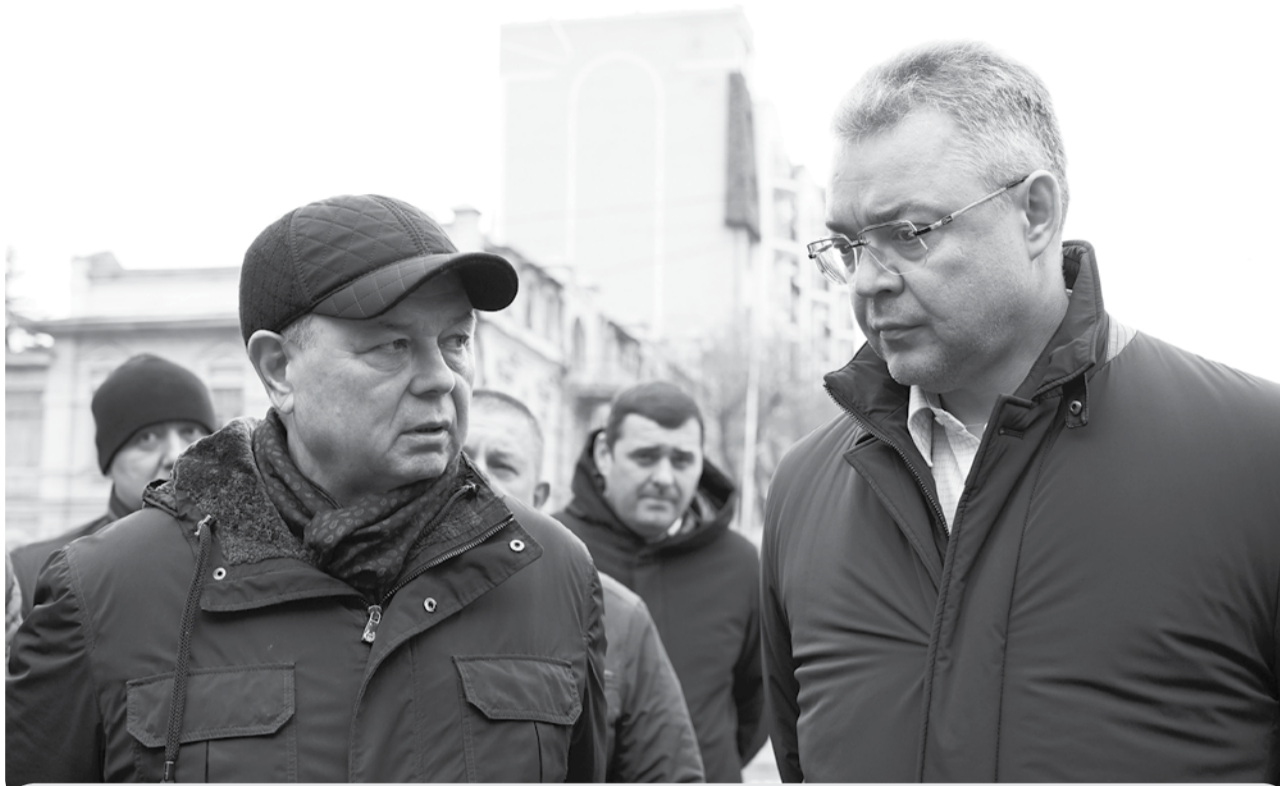
А. Артамонов осматривает объекты, строящиеся в рамках нацпроектов и федеральной программы «Развитие Северо-Кавказского федерального округа».