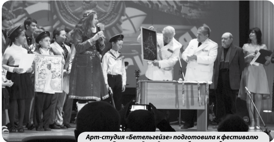
Арт-студия «Бетельгейзе» подготавливает картину «Ракетный крейсер в учебном походе».

Вокальный ансамбль «Бетельгейзе» МБУ ДО ДДТ г. Минеральные Воды принял участие в XIII фестивале морской песни «СПОЁМТЕ, ДРУЗЬЯ!», который прошел в Пятигорске. Фестиваль был посвящён 325 годовщине образования Российского флота.