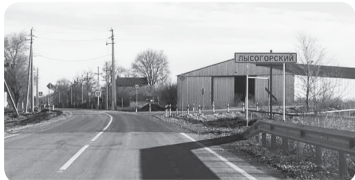
В хуторе Лысогорском обустроены также тротуары и установлено уличное освещение.

В хуторе Лысогорском Минераловодского городского округа полностью завершены работы по обеспечению транспортной доступности.