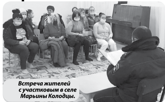
Встреча жителей с участковым в селе Марьины Колодцы.

лиции разъяснил нюансы действующего законодательства, рассказал о мерах личной безопасности и сохранности имущества. Также полицейским была проведена адресная проверка лиц, состоящих на профилактическом учете.