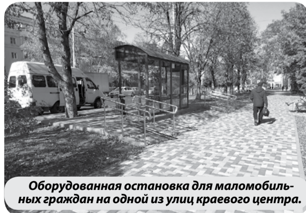
Оборудованная остановка для маломобильных граждан на одной из улиц краевого центра.

регионального и местного – в 2021 году на эти цели направлено более 1,3 млрд рублей.