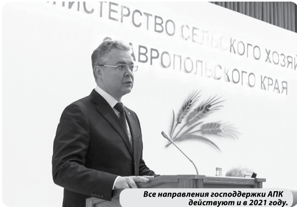
Все направления господдержки АПК действуют и в 2021 году.

– Прошлый год продемонстрировал возросшую устойчивость ставропольского села. Мы сохранили хозяйство, и это главное. Все направления господдержки отрасли, проекты развития диверсификации сельхозпроизводства, действуют и в нынешнем