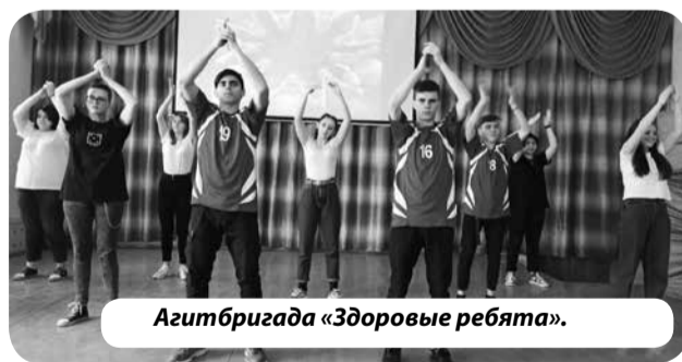
Агитбригада «Здоровые ребята».

Для участия во втором этапе конкурса студенты колледжа подготовили яркое выступление агитбригады «Здоровые ребята», которое прошло в формате онлайн.