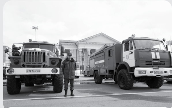
Техника, задействованная в системе предупреждения ЧС на Ставрополье.

Перед началом совещания его участникам на площади Ленина в Ставрополе были представлены образцы техники и оснащения, задействованных в