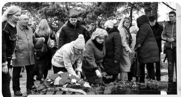
Цветы к обелиску в память о погибших.

В результате теракта погибли 24 человека, более 120 получили ранения. Спустя два десятилетия после чудовищного по своему замыслу и исполнению преступления минераловодцы почтили память жертв теракта минутой молчания, возложили к обелиску живые цветы и зажгли поминальные свечи.