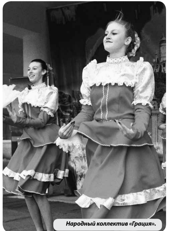
Народный коллектив «Грация».

«Ассорти» под руководством Людмилы Измайловой в 2021 году успешно представил наш округ на более, чем десяти краевых, всероссийских и междуна-