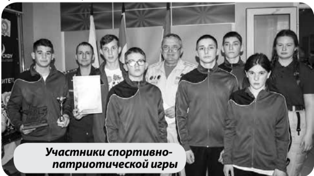
Участники спортивно-патриотической игры

В состав команд вошли воспитанники, выпускники детских домов и их наставники. Команды показали свои знания на девяти этапах: творческий конкурс, страницы истории, разборка/сборка ММГ АКМ-74, снаряжение магазина, электронный тир, огневой рубеж, шифровка, территория спорта, штурм. Первым стал ГКУ «Санаторный детский дом № 12» краевой столицы.