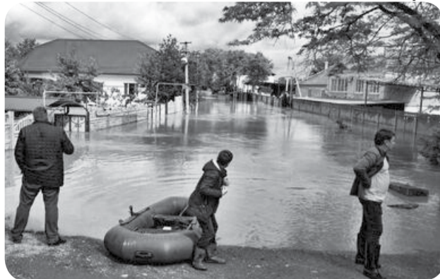
ЧС природного характера в Минераловодском округе нередки.

гласно Федеральному закону «О ветеринарии», животные подлежат идентификации и учету в целях предотвращения распространения заразных падений, а также выявления источника и путей распро-