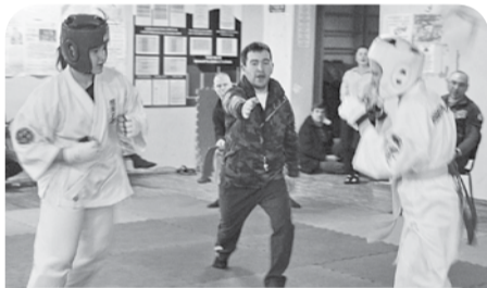
Судьи готовятся к соревнованиям также, как и спортсмены.