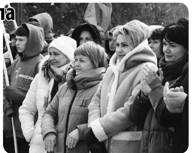
Зрители выразили поддержку президенту России.

В Минеральных Водах праздничные мероприятия, посвященные восьмой годовщине воссоединения Крыма с Россией, завершались в сквере «Надежда». Здесь была представлена концертная программа «Россия. Крым. Донбасс», которая прошла под единым лозунгом: Россия за мир! Россия своих не бросает!