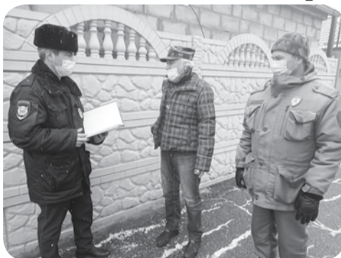
Участковые уполномоченные полиции Отдела МВД России по МГО организовали мероприятия «Участок» и провели беседы с жителями округа.

Совершавшим ранее противоправные деяния полицейские напомнили о недопустимости нарушения действующего законодательства.