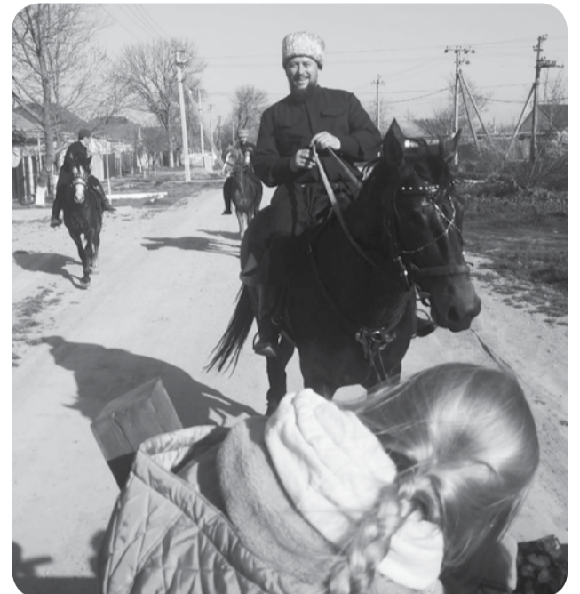
Гостей встретили по всем законам казачьего гостеприимства.

Возможности сельского туризма с этнографической составляющей ярко показало активно развивающееся подворье «Казачья поляна имени генерала А.П. Ермолова» в селе Солдато-Алек-