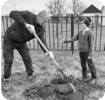
В 2022 году в МГО высадят 300 деревьев.

Еще 40 деревьев в Минераловодском округе пополнили «Сад памяти». «Сад памяти» - акция, в рамках которой в стране ежегодно в память о погибших во время Великой Отечественной войны высаживаются тысячи молодых деревьев.