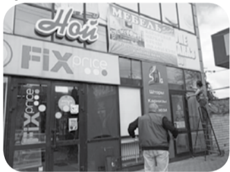
Любая реклама должна быть согласованной.

Еще несколько магазинов по улице Ставропольской в Минеральных Водах лишились своих вывесок, а здание, в котором находятся эти коммерческие организации и ИП, приобрело должный вид. Вывески не были зарегистрированы и согласованы с Управлением муниципального хозяйства АМГО.