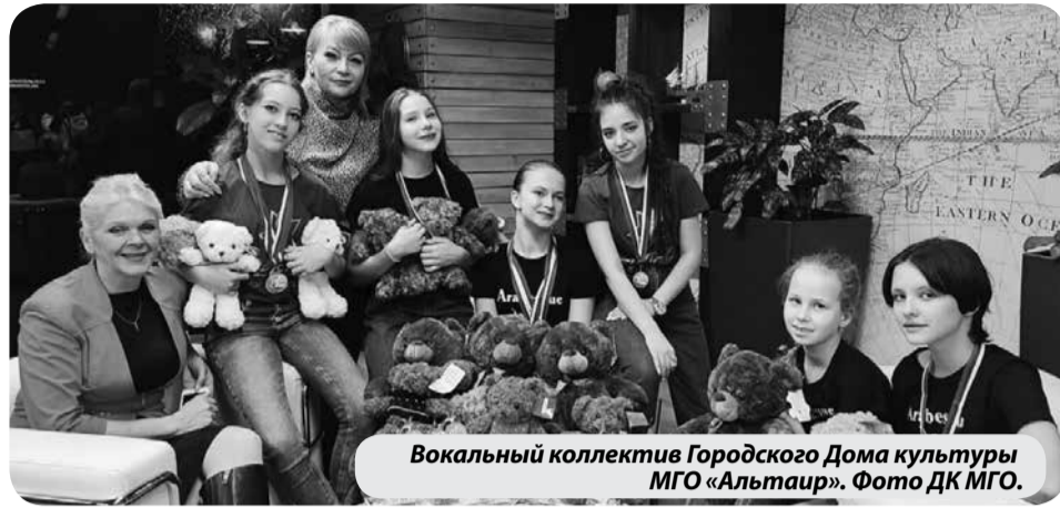
Вокальный коллектив Городского Дома культуры МГО «Альтаир».

В Нижнем Новгороде состоялся Международный конкурс-фестиваль «Алиса» общественного фестивального движения «Дети России» и творческой молодежной ассоциации «Лири» (г. Санкт-Петербург).