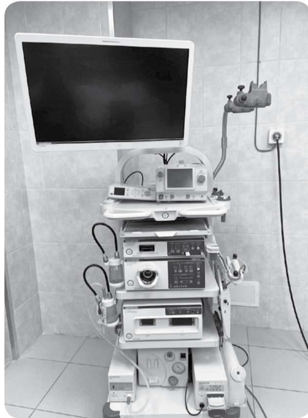
Новое эндоскопическое оборудование в Ставропольском краевом онкодиспансере расширяет возможности для диагностики рака.

Как отметили в краевом минздраве, региональный проект «Борьба с онкологическими заболеваниями» в рамках нацпроекта «Здравоохранение» реализуется на Ставрополье в полном объёме. В этом году было выделено более 527 млн рублей, из них законтрактовано более половины.