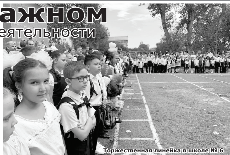
Торжественная линейка в школе № 6