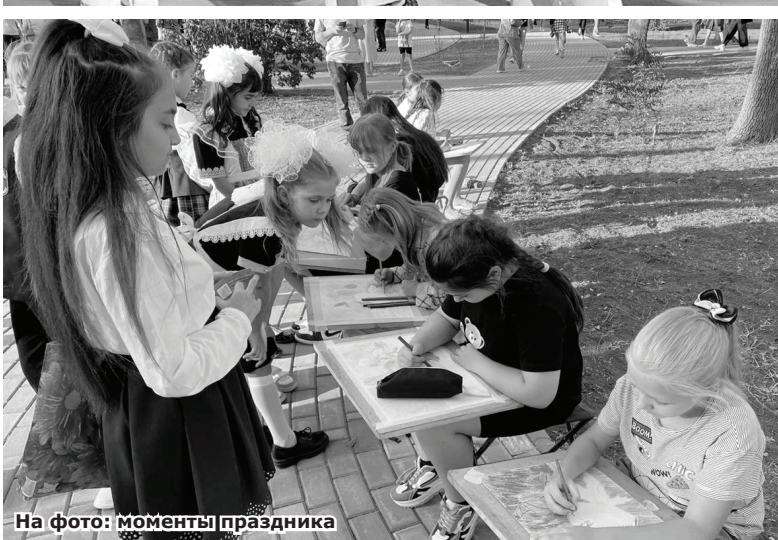
На фото: моменты праздника

Открытие сквера после масштабного капремонта стало настоящим праздником для поселковцев - именно для них в первую очередь и создавалась эта красота.