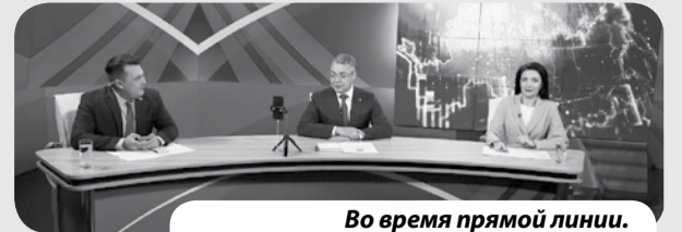
Во время прямой линии.

Дорога сегодня находится в собственности муниципалитета, специалисты занимаются подготовкой проектно-сметной документации, чтобы у нас была в дальнейшем возможность участвовать в конкурсе на