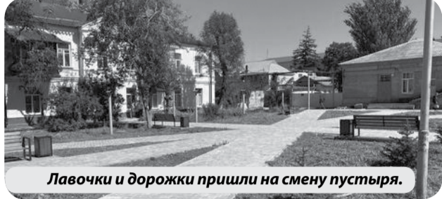
Лавочки и дорожки пришли на смену пустыря.

В МГО в рамках приоритетного проекта «Формирование комфортной городской среды» проходит благоустройство Привокзальной площади и прилегающей к ней территории.