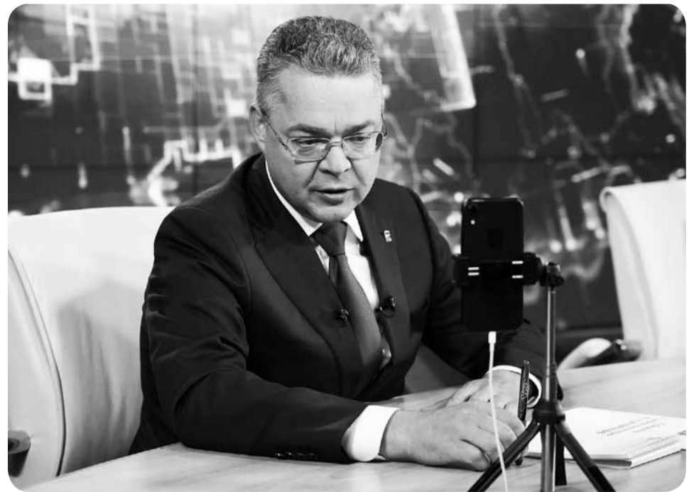
Губернатор Владимир Владимиров отвечал на вопросы жителей края в прямом эфире.

В минувшую среду, 29 сентября, состоялась седьмая в этом году прямая линия главы Ставрополя. Губернатор Владимир Владимиров отвечал на вопросы жителей края в прямом эфире. Обращения касались важных тем, в числе которых вакцинация, начало отопительного сезона, ремонт дорог, работа школ и детских садов в условиях пандемии коронавируса и другие.