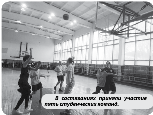
В состязаниях приняли участие пять студенческих команд.

стала команда филиала БГТУ, второе место у колледжа «Перспектива», третье — у МРМК.