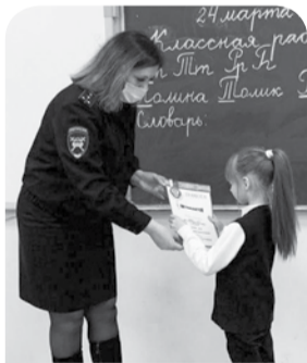
Участники урока были награждены грамотами и призами - светоотражающими наклейками и браслетами.