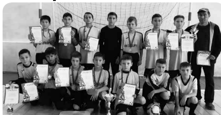
Команда «Эльбрус» с Канглы - серебряный призёр турнира.

матча сумели сломить сопротивление «Спартак-Юниор» (2:0). В решающем матче уверенную победу одержали гости из с. Новоселицкого и завоевали «золотые» медали первенства. В матче за 3 место удача была на стороне «Урарту».