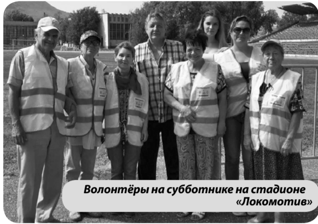
Волонтеры на субботнике на стадионе «Локомотив»

Именно этим в Минераловодском округе занимаются с 2016 года волонтеры общественной организации «Общественный Беспристрастный Союз Единомышленников» («Лига добра»), помогающие полноценно и ярко жить пенсионерам.