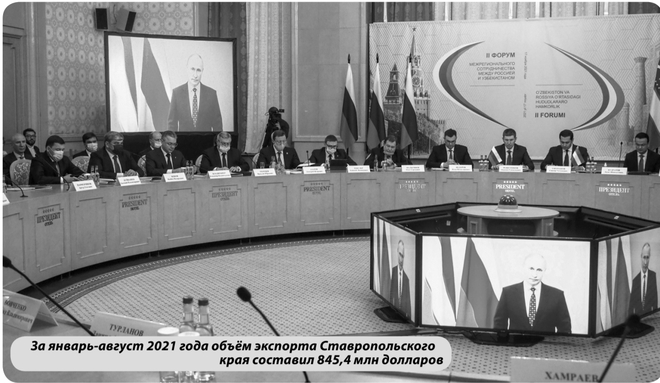
За январь-август 2021 года объём экспорта Ставропольского края составил 845,4 млн долларов

Как отметил Владимир Путин, Россия является одним из основных инвесторов в экономику Узбеки-