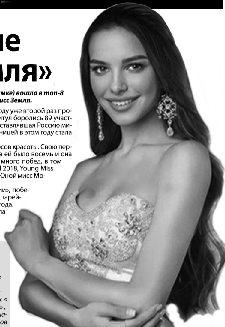
Фото из аккаунта #MissEarth2021 (Мисс Земля-2021)

Мисс Земля - это ежегодный международный конкурс красоты на тему окружающей среды, пропагандирующий экологическое сознание, охрану окружающей среды и социальную ответственность. Конкурс является третьим по величине конкурсом красоты в мире по количеству конкурсов национального уровня для участия в мировых финалах. Наряду с «Мисс мира», «Мисс Вселенная» и «Мисс Интернешнл», этот конкурс входит в «Большую четверку» международных конкурсов красоты - самых желанных титулов красоты среди всех международных конкурсов.