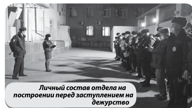
Личный состав отдела на построении перед заступлением на дежурство

- Как сотрудники полиции несут службу в условиях пандемии?