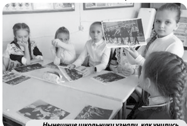
Нынешние школьники узнали, как учились их бабушки и дедушки.

Ученики СШ № 19 села Побегайловки активно участвуют во Всероссийском проекте развития социальной активности младших школьников «Орлята России».