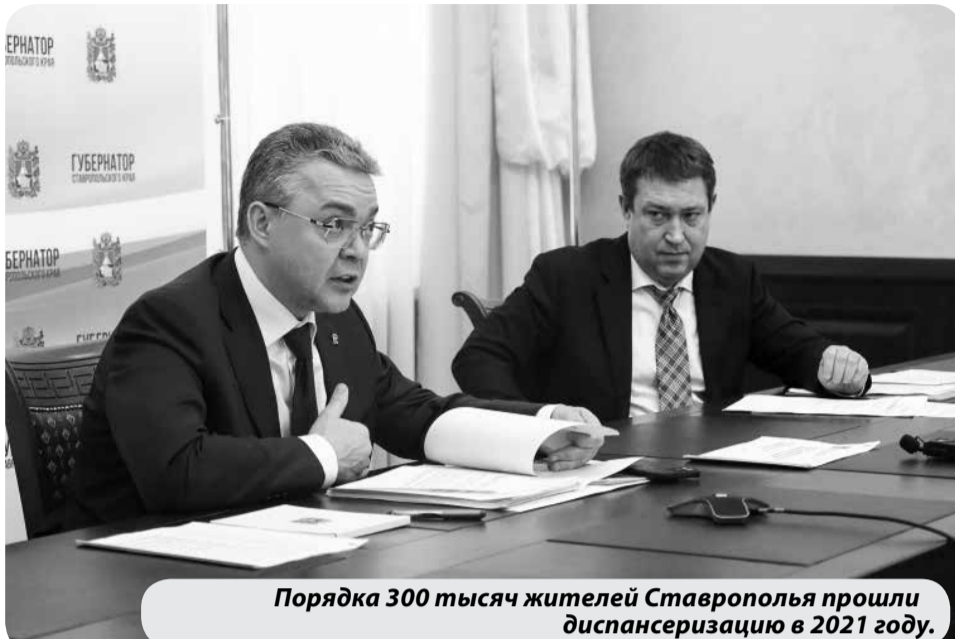
Порядка 300 тысяч жителей Ставрополья прошли диспансеризацию в 2021 году.

Так, в отдалённых территориях врачебные осмотры проводятся также в рамках проекта «За здоровье». За 11 месяцев состо-