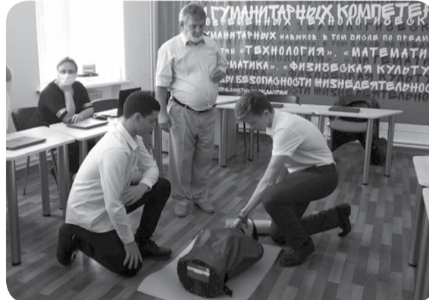
В 2021 году центры естественнонаучного и технологического профиля «Точка роста» открылись в школах №8 с. Ульяновка и №14 х. Красный Пахарь.

Всем учащимся 1-4 классов будут вручены губернаторские подарки.