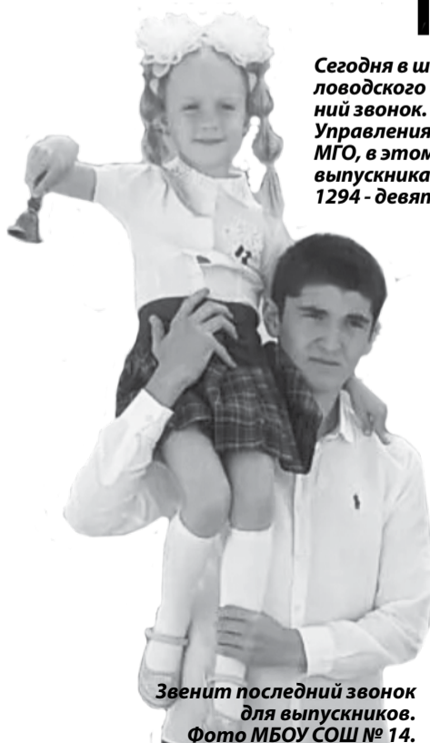
Звонят последний звонок для выпускников.