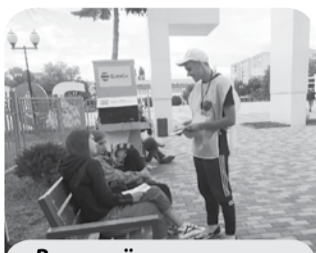
Волонтеры помогают голосовать

На голосование выставлено три объекта: «Пешеходная зона по улице Железноводская в городе Минеральные Воды», «Парк по улице Исакова в поселке Анджиевский» и «Сквер по улице Яблонева в хуторе Красный Пахарь». На сегодняшний день свой выбор сделали более 10200 жителей муниципалитета.