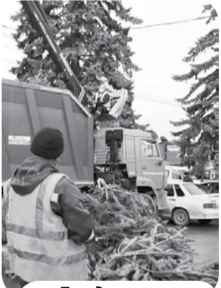
Твердые остатки елок служат животным подстилкой.

Светлана Турицева. Пресс-служба РО ООО «ЖКХ» Фото автора