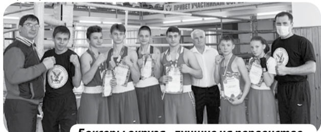
Боксеры округа - лучшие на первенстве