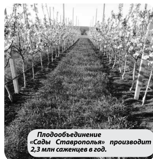
Плодообъединение «Сады Ставрополья» производит 2,3 млн саженцев в год.

Управление по информационной политике аппарата Правительства Ставропольского края (по материалам пресс-службы губернатора Ставропольского края, ОИВ Ставропольского края)