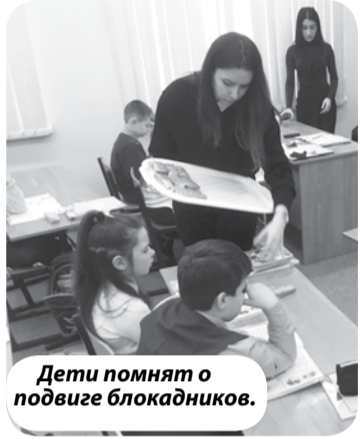
Дети помнят о подвиге блокадников.

Более 30 школьников МБОУ СОШ № 14 х. Красный Пахарь Минераловодского округа приняли участие в акции «Блокадный хлеб». Мероприятие было приурочено к памятной дате – 77-летию со дня снятия блокады Ленинграда.