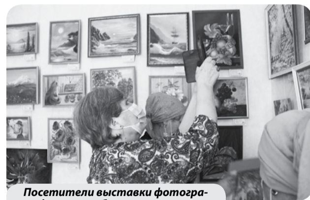
Посетители выставки фотографируют работы на память