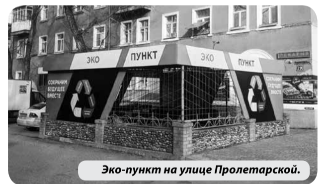
Эко-пункт на улице Пролетарской.

Прием вторсырья осуществляется по адресу: город Минеральные Воды, улица Пролетарская 19 (пересечение улиц Карла Маркса и Пролетарская). По желанию заказчика осуществляется вывоз вторсырья. Подробную информацию о работе экопункта можно узнать по телефону +79620297007.