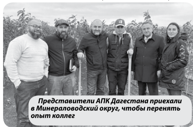
Представители АПК Дагестана приехали в Минераловодский округ, чтобы перенять опыт коллег

Так, в Республиках Северного Кавказа заинтересовались грантовой поддержкой, организованной Правительством СК и Министерством сельского хозяйства СК. В Карачаево-Черкесской Республике организовано предоставление грантов сельскохозяйственным потребительским кооперативам