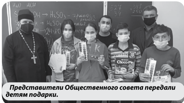
Представители Общественного совета передали детям подарки.

Общественники вручили ребятам канцелярские принадлежности, краски, а также сладкие подарки. А ребята пообещали прислушаться к советам.