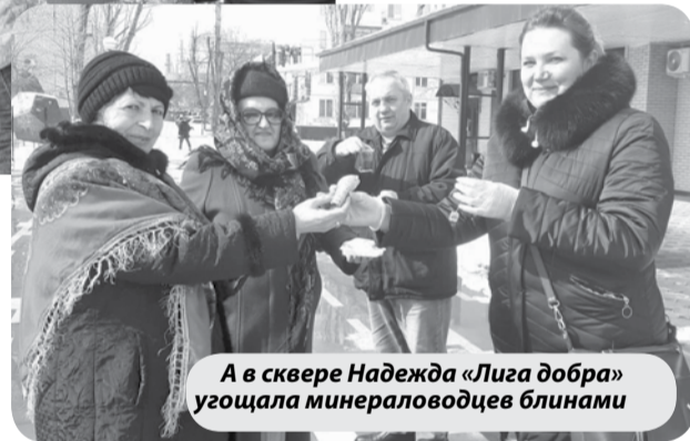
А в сквере Надежда «Лига добра» угощала минераловодцев блинами