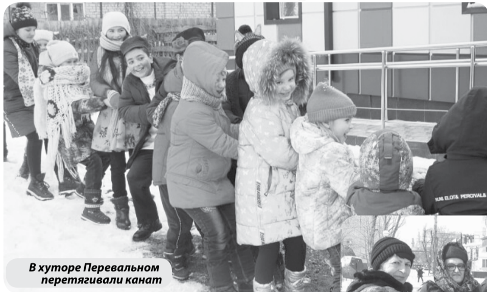
В хуторе Перевальном перетягивали канат

Площадка в сквере собрала несколько десятков горожан. Здесь были и совсем маленькие минераловодцы, их родители, а также представители старшего поколения. Независимо от разницы в возрасте, все они принимали самое активное участие в народных забавах, играх, конкурсах, которые имели сегодня место быть.