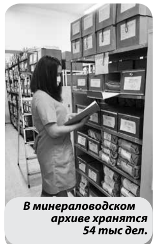
В минераловодском архиве хранятся 54 тыс дел.

Записала Елена Еремينا.