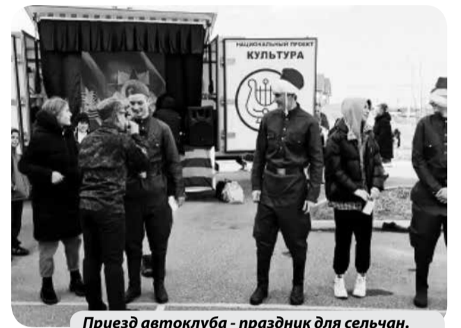
Приезд автоклуба - праздник для сельчан.

С начала текущего года с участием Автоклуба было организовано более 13 игровых и концертных программ, часть из которых, к примеру, была посвящена прошедшему Дню защитника Отечества и Международному женскому дню.