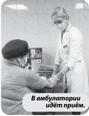
В амбулатории идёт приём.

Врачебная амбулатория в поселке Новотерском распахнула свои двери для пациентов после капитального ремонта.