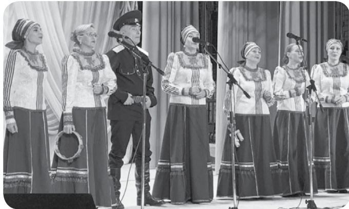
По материалам Инстаграм-аккаунта @dk_pervomaiskiy_10. Фото из аккаунта.