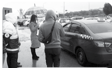
В 11 из 13 вызванных такси были детские кресла.

Акцию под таким названием провели сотрудники ОГИБДД ОМВД России по МГО совместно с инспекторами отдельного спецбатальона ДПС ГИБДД г. Ессентуки, а также с представителем казачества, управления муниципального хозяйства АМГО, общественным советом при ОМВД, волонтерами молодежного центра.