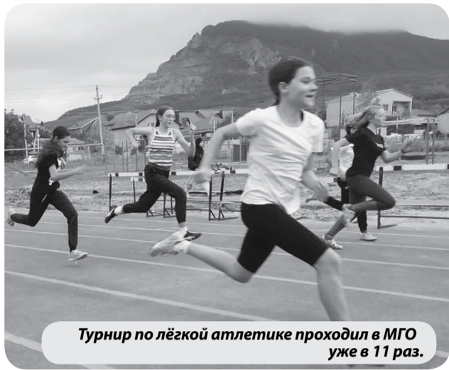
Турнир по лёгкой атлетике проходил в МГО уже в 11 раз.

Минераловодские спортсмены завоевали 15 медалей на региональном турнире по лёгкой атлетике