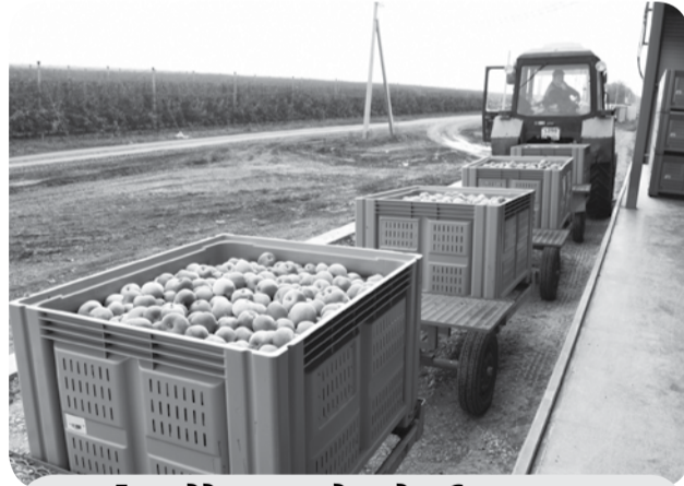
Господдержка садоводов Ставрополья в 2021 году составила 482 млн рублей.

Также до конца года ставропольские аграрии смогут получить 80 млн рублей в виде грантов на развитие садов в личных подсобных хозяйствах; 6,2 млн рублей – на раскорчевку старовозрастных садов; 4 млн – на посадку и уход за ягодниками, ещё 2 млн предназначено на выращивание посадочного материала плодовых растений.