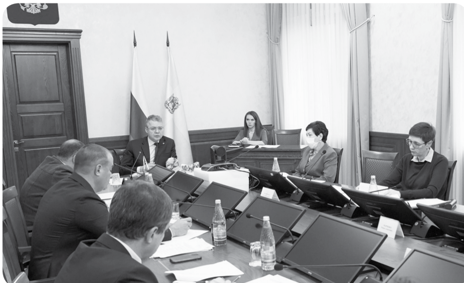
К 2030 году на Ставрополье планируется создать более 150 тысяч новых рабочих мест.

Владимир Владимирович подчеркнул важность модели для принятия управленческих решений, направленных на достижение в крае национальных целей развития.