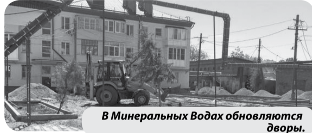
В Минеральных Водах обновляются дворы.

Как пояснили в управлении муниципального хозяйства администрации Минераловодского городского округа, работы по благоустройству всех трех дворов планируется завершить до конца мая текущего года.