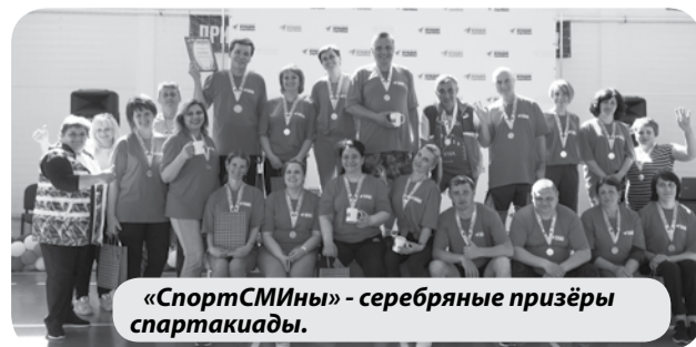
«СпортСМИны» - серебряные призёры спартакиады.