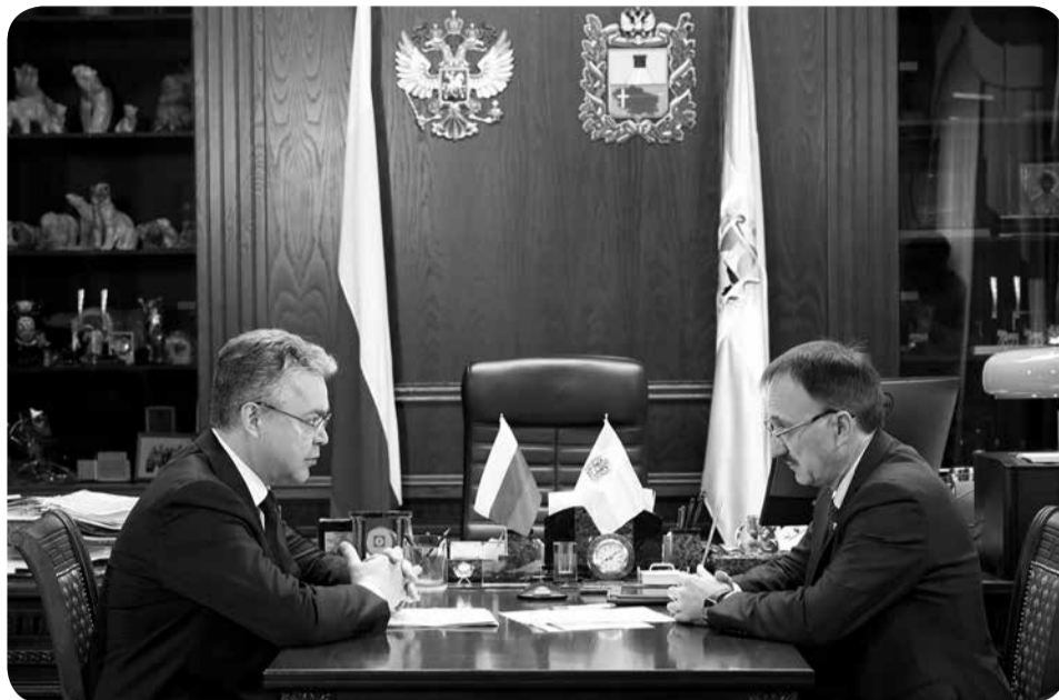
Владимир Владимиров: «Везде, где находятся дети, должна быть высокая защищённость.»