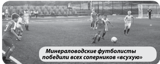
Минераловодские футболисты победили всех соперников «всухую»

В соревнованиях среди юношей 2007-2008 г.р. сборная МГО «Локомотив» U-14 (тренер Н. Авраменко), собранная на базе МКУ ДО ДЮСШ в первом матче переиграла оппонентов из ессентукской СШОР ИВС - 4:0. Во втором туре наши футболисты оказались сильнее игроков из СШОР №6 (Пятигорск) - 6:0. В матче третьего тура была повержена команда «Предгорье» (ст. Ессентукская) - 10:0.