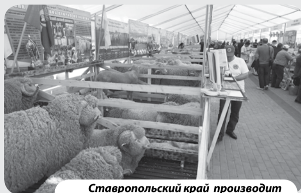
Ставропольский край производит 9% российской баранины и 13% шерсти.