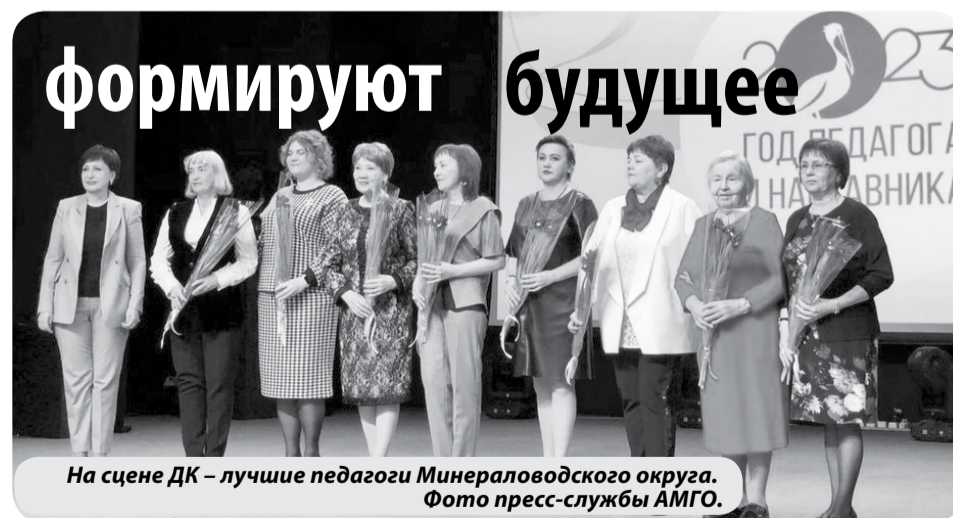
На сцене ДК — лучшие педагоги Минераловодского округа.

В холле ДК перед церемонией открытия развернулась площадка с мастер-классами, на которых любой желающий мог проверить себя в сборке-разборке автомата, оказании