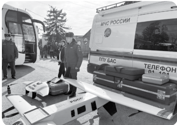
На снимках: на учениях.

пострадал от наводнения. Мы отработали спасение пострадавших и их транспортировку, сплав по реке, эвакуацию и обогрев местных жителей, воздушную разведку и многое другое. Было привлечено более 50 единиц техники и 300 человек личного состава. Все службы профессионально справились с поставленными задачами», - поделился глава округа Вячеслав Сергиенко.