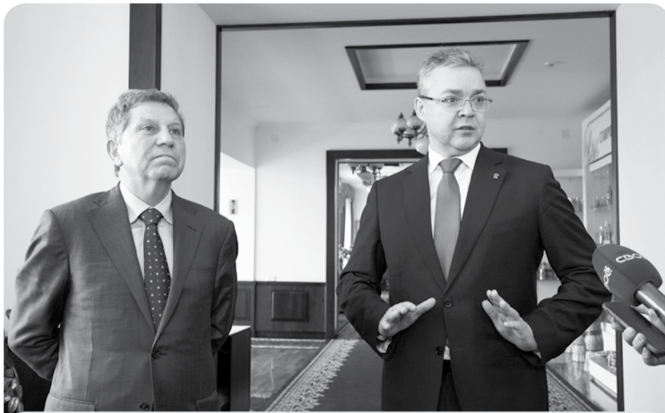
В. Владимиров: «Российская нефтяная компания является партнёром края в реализации двух из пяти «прорывных» проектов региональной модели экономического развития на период до 2030 года».

– Сегодня наши стратегические партнёры подхватили активы и проекты ушедшей из России иностранной компании. Они управляют крупнейшим электрогенерирующим объектом региона – Невин-