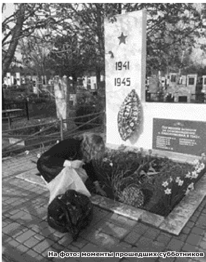
На фото: моменты прошедших субботников