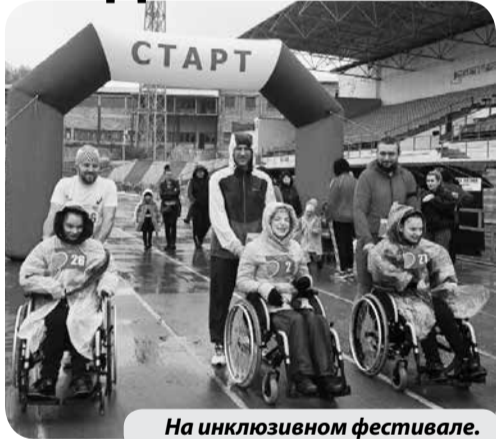
На инклюзивном фестивале.

Члены Регионального отделения инвалидов - колясочников и детей с ДЦП приняли участие в Открытом благотворительном инклюзивном Фестивале «Одни из нас».