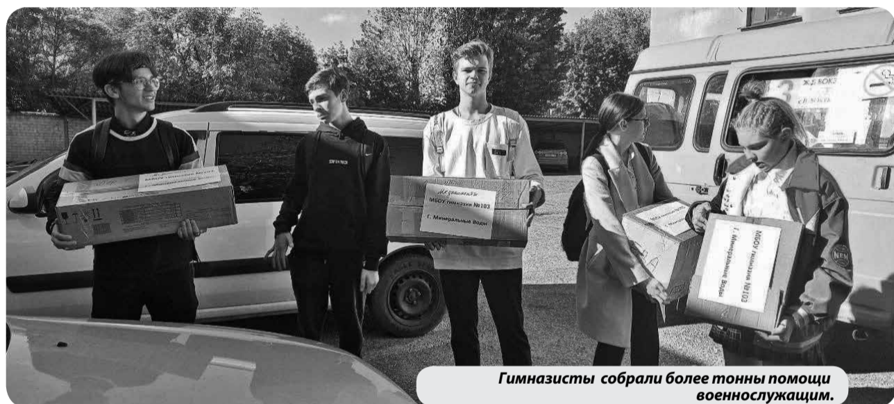
Гимназисты собрали более тонны помощи военнослужащим.

Учащиеся гимназии №103 города Минеральные Воды собрали свыше тонны помощи военнослужащим, которые отправляются на военную службу в рамках частичной мобилизации.