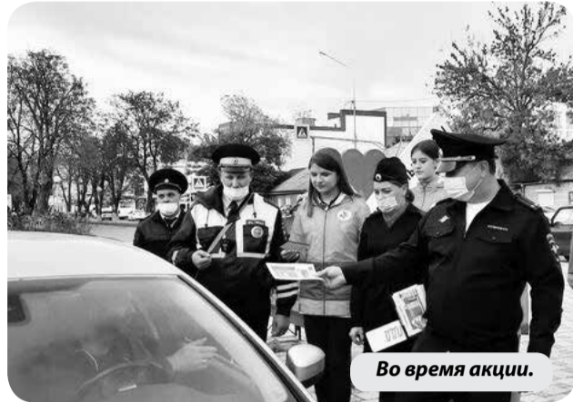
Во время акции.

Автоинспекторы совместно с волонтерами Минераловодского городского округа, а также администрации муниципалитета провели профилактическую акцию, которая была посвящена Международному дню белой трости.