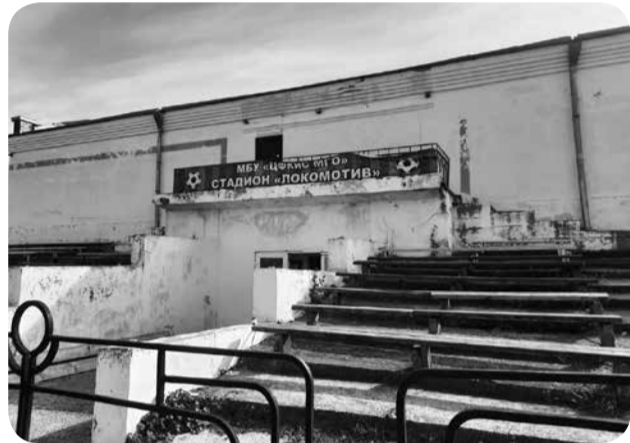
Стадиону «Локомотив» больше 60 лет.