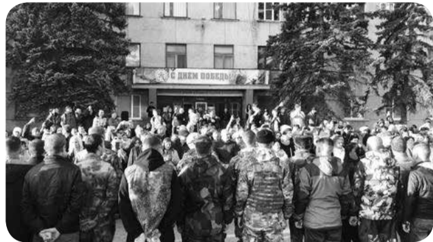
Родные и близкие провожают мобилизованных у военкомата.

Провожать их пришли сотни жителей муниципалитета.