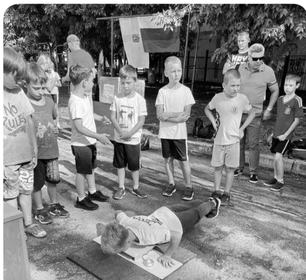
Юные минераловодцы сдают нормативы ГТО.

«В последние годы интерес к выполнению нормативов ГТО в нашем округе заметно вырос: только за последние девять месяцев проверить себя на прочность решились две сотни наших зем-