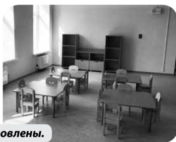
Мебель и оборудование установлены.

лионов – средства из федерального бюджета, остальные средства выделены из краевого и муниципального бюджетов. Работы проводились