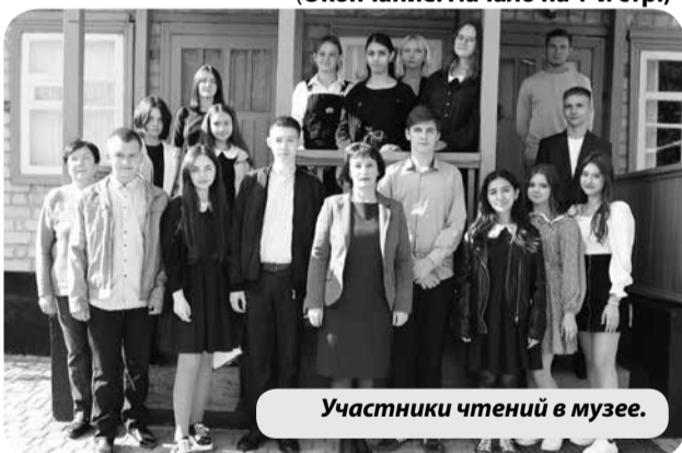
Участники чтений в музее.