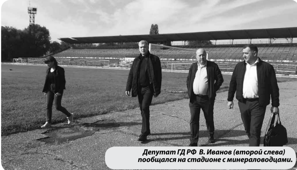
Депутат ГД РФ В. Иванов (второй слева) общался на стадионе с минераловодцами.

Владимир Валерьевич осмотрел чашу стадиона, побывал в подтрибунных помещениях, пообщался с представителями администрации стадиона, тренерско-педагогического состава, а также с местными спортсменами-любителями, занимающимися здесь физкультурой, которые единогласно подтвердили: жители округа очень ждут восстановления этого легендарного для Минеральных Вод спортивного объекта.