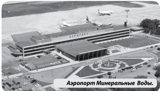
Аэропорт Минеральные Воды.

В конце марта — начале апреля текущего года планируется заключение контракта по строительству нового аэровокзального комплекса внутренних воздушных авиалиний на территории международного аэропорта «Минеральные Воды» имени М. Ю. Лермонтова. Все работы, общий объем финансирования которых составит порядка 14 миллиардов рублей, завершат в начале 2025 года.