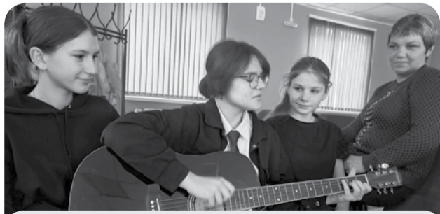
Юные перевальненцы помнят песни, которые любили их бабушки и дедушки.

Работники ДК подготовили для ребят обзор о выдающихся российских бардах - Булате Окуджаве, Владимире Высоцком, Олеге Митяеве, Александре Розенбауме, Юрии Визборе. В ходе программы прозвучали их популярные песни, полюбоившиеся не одному поколению наших сограждан.