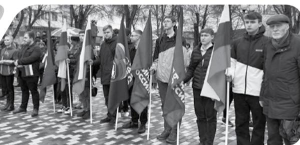
По материалам и фото пресс-службы АМГО. На снимках: праздник на вокзале и в городском парке.