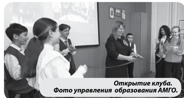
Открытие клуба.

Сейчас по всей России создаются клубы «Большой перемены» – мини-представительства конкурса в школах, секциях, кружках. Миссия клубов – создание сообщества единомышленников для реализации инициатив и способностей обучающихся, родителей и педагогов.