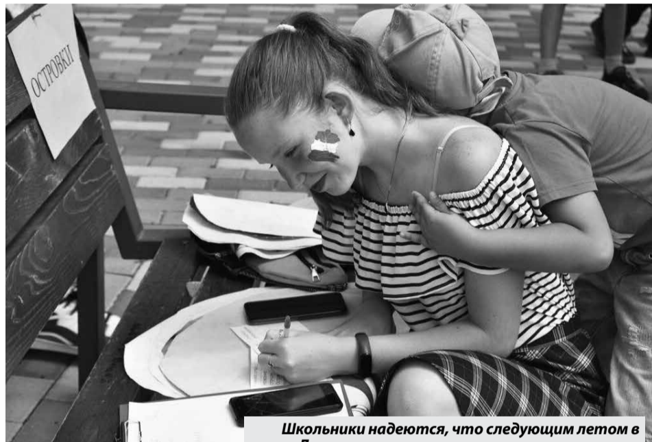
Школьники надеются, что следующим летом в «Дневнике вожакого» появятся новые записи.