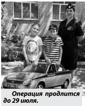
Операция продлится до 29 июля.

Сотрудники Госавтоинспекции проводят в детских садах с детьми занятия по дорожной безопасности. Так же автоинспекторы организуют профилактические акции такие как: «Перевези ребёнка в безопасности!», «Юный дисциплинированный велосипедист», «Будь заметней на дороге!» и др. Кроме того, будет усилен контроль за соблюдением водителями скоростных режимов, правил перевозок детей-пассажиров.