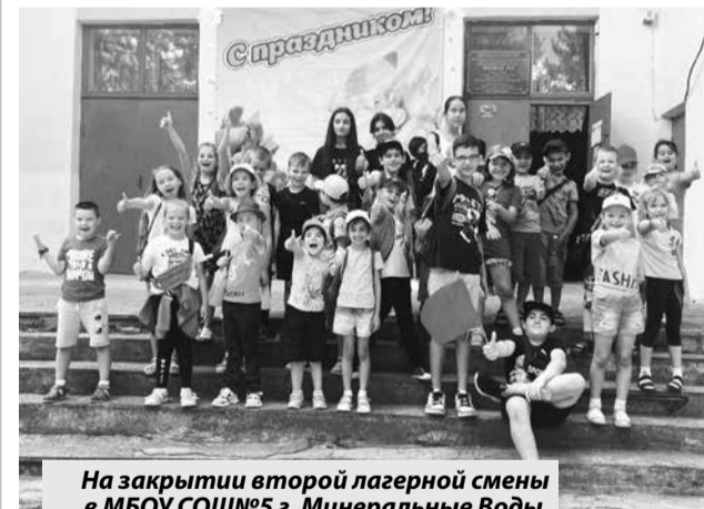
На закрытии второй лагерной смены в МБОУ СОШ №5 г. Минеральные Воды.