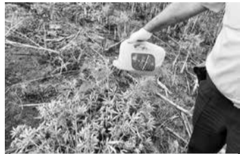
Рейды по уничтожению очагов произрастания конопли продолжатся до конца сентября.

В рамках проведения второго этапа межведомственной комплексной оперативно-профилактической операции «Мак — 2022» в поселке Загорском был обнаружен очаг произрастания дикорастущей конопли.