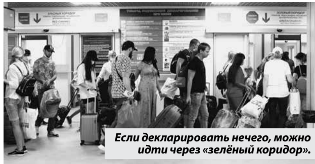
Если декларировать ничего, можно идти через «зелёный коридор».