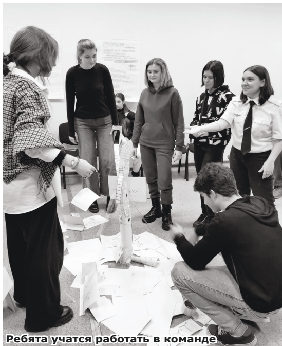
Ребята учатся работать в команде