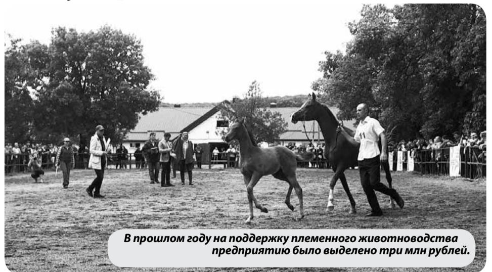
В прошлом году на поддержку племенного животноводства предприятию было выделено три млн рублей.

располагает одним из лучших поголовий арабских лошадей в Европе. Терконзавод насчитывает 315 лошадей арабской чистокровной породы, в том числе 12 жеребцов-производителей и 72 конематки, сообщает минсельхоз края. Предприятие ежегодно получает субсидию на возмещение части затрат на поддержку племенного животноводства. В 2019 году размер субсидии