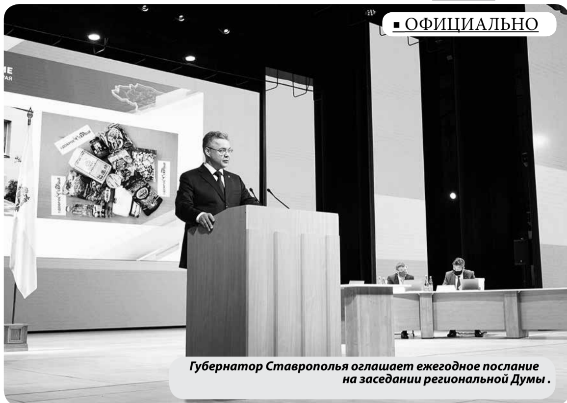
Губернатор Ставрополья оглашает ежегодное послание на заседании региональной Думы.

Он отметил, что в прошлом году бизнес вложил в Ставрополье рекордные 232 миллиарда рублей, что на 12% больше показателя 2019 года.