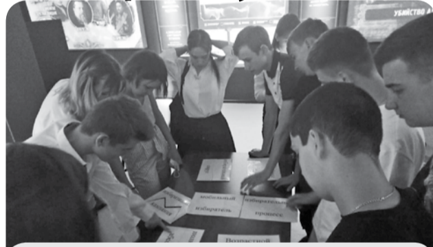
В состав минераловодской команды вошли юноши группы 101 и девушки группы 110.

Игра проходила на базе музейно-выставочного центра «Россия - моя история» в Пятигорске и состояла из трёх туров: блиц-турнир по вопросам избирательного права и избирательного процесса, квест в выставочных залах музея и защита проекта - предвыборной кампании партии. В игре приняли участие восемь команд зоны КМВ.