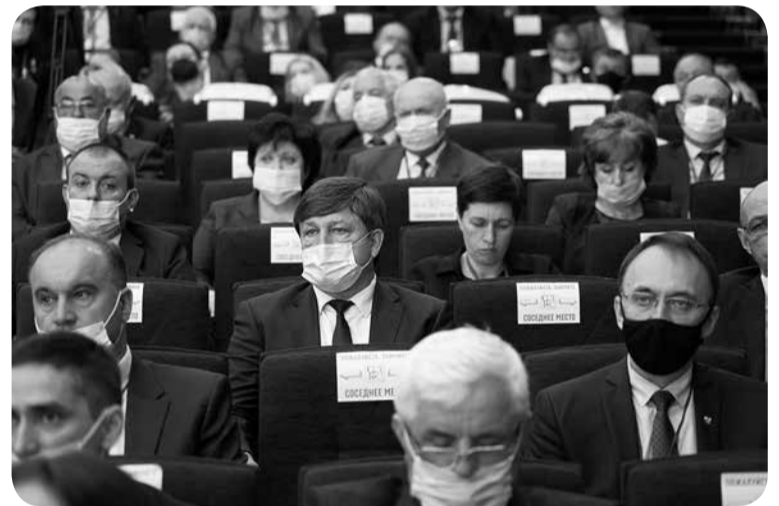
Члены краевого правительства, руководители министерств, ведомств, муниципалитетов заслушали ежегодное послание губернатора В. Владимирова.

законодательством для этой категории граждан предусмотрена ежегодная компенсация на школьную форму. В прошлом году ее получили около 25 тысяч семей.