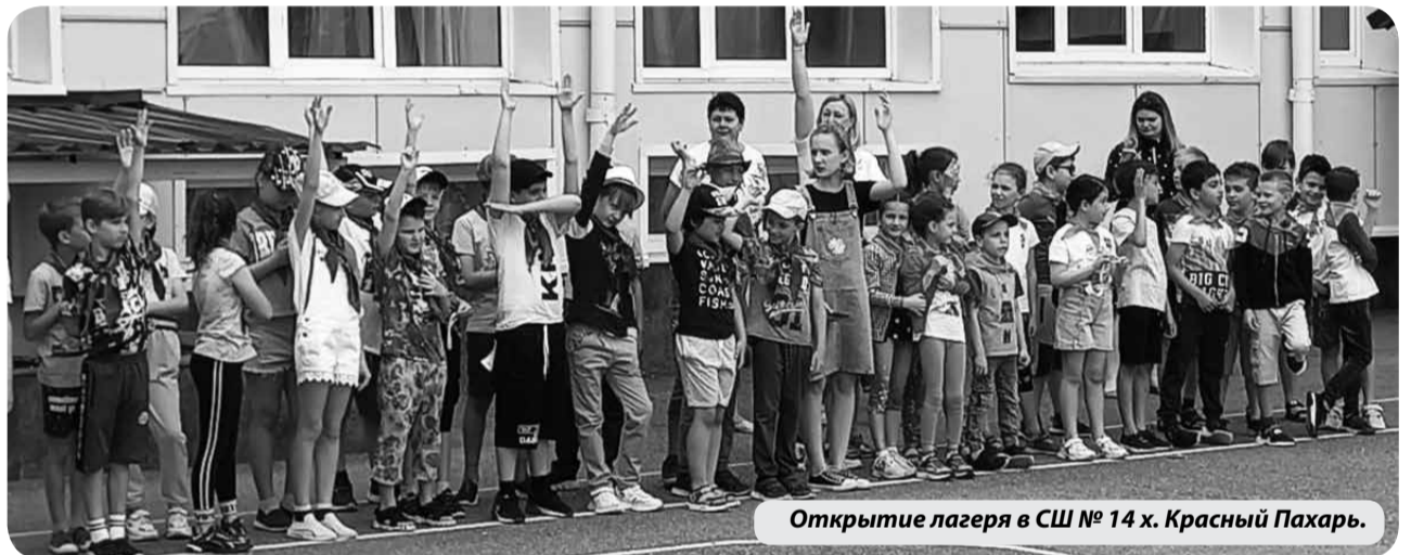
Открытие лагеря в СШ № 14 х. Красный Пахарь.

1 июня, в Международный день защиты детей в Минераловодском округе открыли свои двери 28 оздоровительных лагерей дневного пребывания, где отдохнут 3575 детей за две смены. В летнее время также планируется организация пришкольных площадок без питания, которые будут работать с 14 до 17 часов.