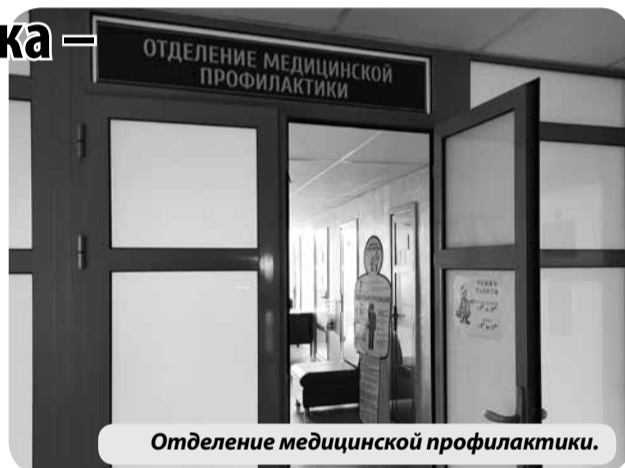
Отделение медицинской профилактики.

- Хочу напомнить, что, по закону, для прохождения диспансеризации предусмотрено предоставление двух оплачиваемых выходных дней. Сейчас работодатели стали ответственно относиться к здоровью своих работников. И многие пациенты