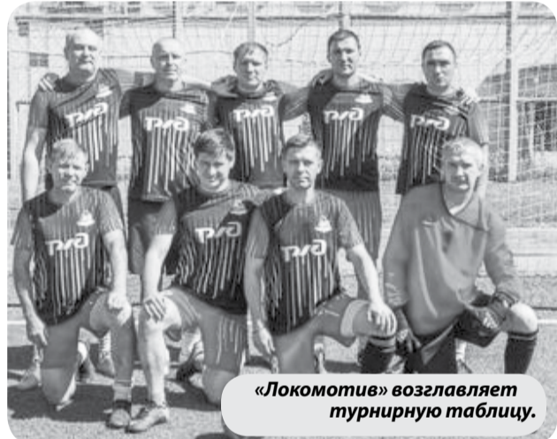
«Локомотив» возглавляет турнирную таблицу.

В минувшие выходные в Ставрополе прошли игры очередного тура первенства Ставропольского края по футболу среди ветеранов. В двух играх минераловодский «Локомотив» взял четыре очка и возглавил турнирную таблицу в группе «D».