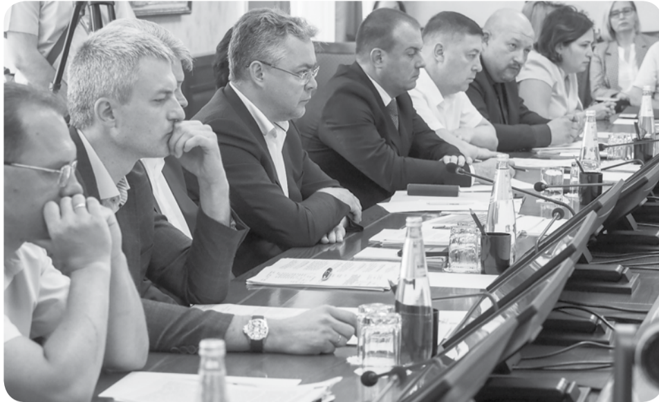
Губернатор Ставрополья: особые экономические зоны помогут развитию региона и Юга России.