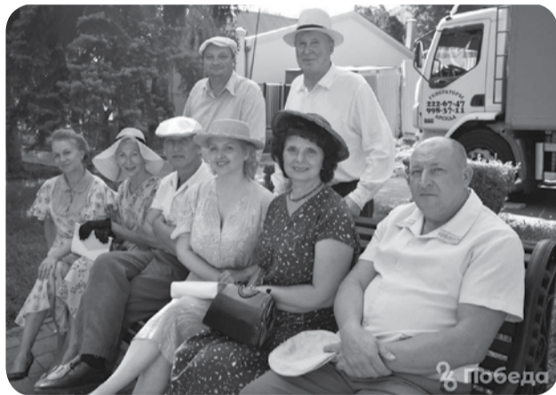
К съемкам 3 сезона сериала «Шифр» съемочная группа приступила в июле 2020 года. Это произошло еще до выхода 2 сезона в эфир. И вот сегодня снимают серии, действие в которых разворачивается в Пятигорске.

годов. В Пятигорск главные герои приезжают на отдых и становятся свидетелями преступления. Также съёмки пройдут в Железноводске — в доме, где последнюю ночь перед дуэлью провёл Лермонтов, и на некоторых улицах курорта, пишет ИА «Победа26».