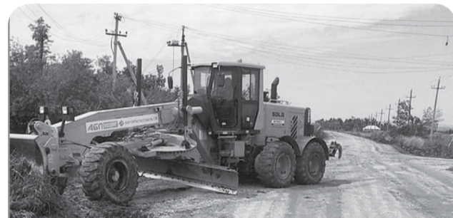
ГУП СК «Ставрополькрайводоканал» запланировал замену водопроводных сетей близ хутора Безивановка.

Местные жители обеспокоены фактом того, что капитальный ремонт автомобильной дороги «Подъезд к хутору Безивановка от автомобильной дороги «Минеральные Воды — Греческое» стартовал с села Марьины Колодцы, а не как это предполагалось, с хутора Безивановка.