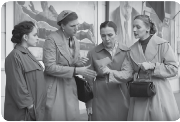
Премьера детектива «Шифр» состоялась в 2019 году. В основу сериала легла британская многосерийная кинолента «Код убийства». Но со слов создателей сериала, была взята только идея. Сюжет адаптировали к советским реалиям 50-60 годов. Одежду для главных героинь шили в костюмерной мастерской Праги.

Съёмочная площадка начала работать утром 25 августа в районе Пушкинских ванн. Здесь были установлены декорации, созданные советскую эпоху 50-х