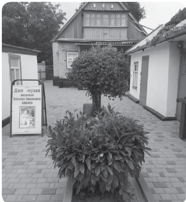
В музее ждем гостей и жителей города для знакомства с постоянной экспозицией, посвященной жизни и творчеству писателя А.П. Библика.

В Минераловодском краеведческом музее им. А.И. Библика продолжается благоустройство территории. Во дворе музея обновили плитку.