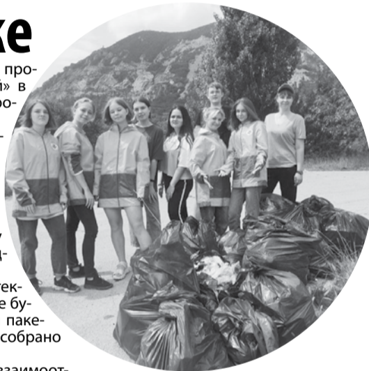
Волонтеры собрали на Змейке около 20 мешков мусора.

Как отметили участники, взаимоотношение человека с природой является одним из актуальных вопросов современности, и подобные акции крайне необходимы для формирования экологической культуры молодежи округа. Между тем, поддержка экологии не должна ограничиваться только такими мероприятиями. Чтобы