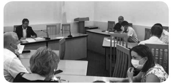
Заседание антитеррористической комиссии.

В администрации Минераловодского округа состоялось заседание антитеррористической комиссии, где обсудили обеспечение безопасности при проведении мероприятий в сентябре.