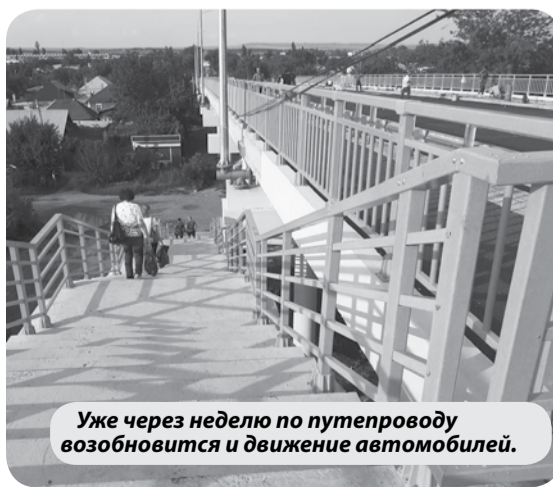
Уже через неделю по путепроводу возобновится и движение автомобилей.

— Взвесив все «за» и «против», принял решение о продлении ограничения движения по путепроводу вплоть до завершения на нем ремонта, то есть до 31 августа включительно. Соответствующий документ мной подписан. Через неделю, в среду, мы откроем путепровод целиком уже полностью отремонтированным, — пояснил глава округа.