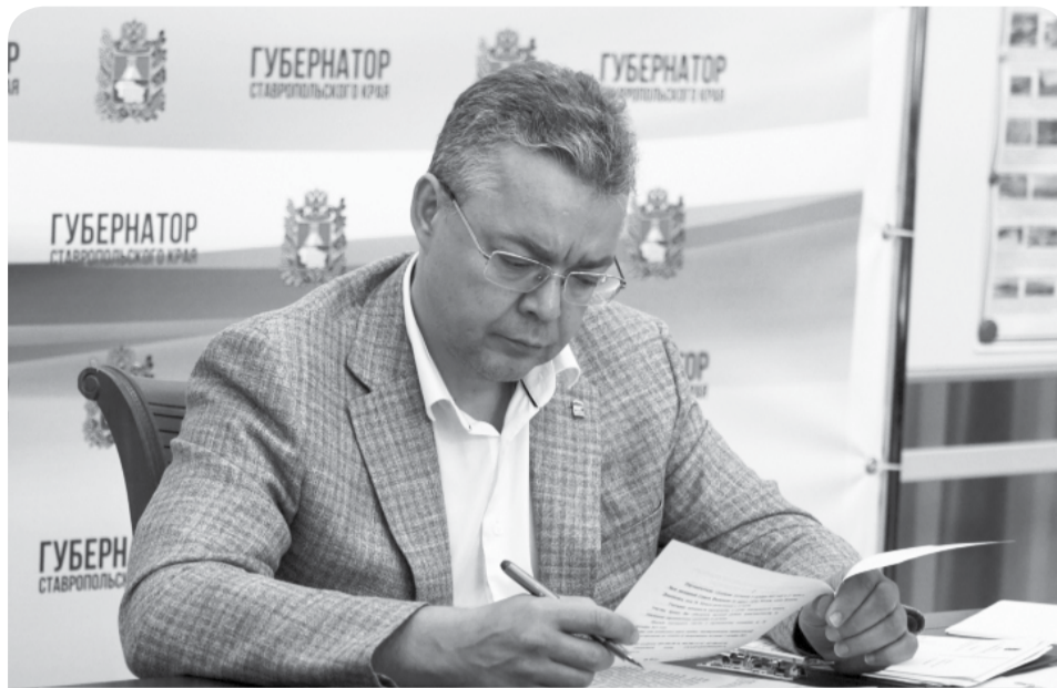
Ставропольский край готовится к новому учебному году в плановом режиме.

Заместитель Председателя Правительства РФ Татьяна Голикова провела в режиме видеоконференц-связи совещание с регионами страны по вопросам готовности к предстоящему учебному году. В нём приняли участие министр просвещения РФ Сергей Кравцов, главы субъектов федерации, в том числе – губернатор Ставрополья Владимир Владимиров.