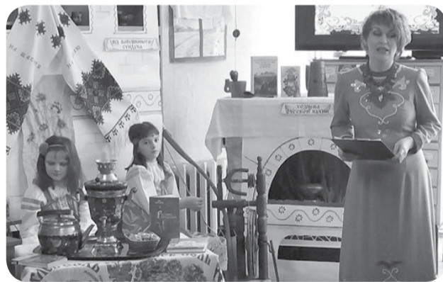
Для младших школьников сотрудники отдела проводят занятия по программе клуба «Юный краевед». Работает кружок декоративно-прикладного творчества «Куклы, исполняющие желания», где все желающие могут приобрести к русской культуре через изготовление кукол-оберегов.

ями КМВ. Хочется отметить сотрудничество с городской школой №1, на базе которой действует «Краеведческая площадка», лицей №3 и школу №4 поселка Анджиевский – за активное участие в краеведческих акциях и мероприятиях.