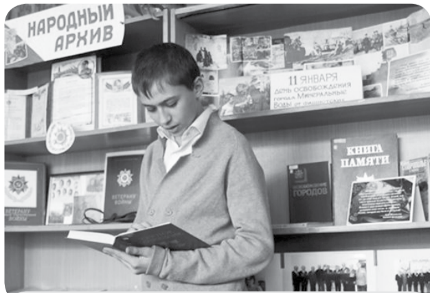
На втором этаже библиотеки действует музейная выставка «Помни! Гордимся! Чтим!», посвященная Великой Отечественной войне. Она знакомит читателей с трагическими страницами истории города, рассказывает о Героях Советского Союза – минераловодцах, о трудовых и боевых подвигах наших земляков.

За годы работы у отдела появились замечательные