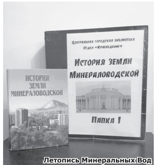
Летопись Минеральных Вод

дороги. По его же инициативе реконструировали пионерский лагерь «Бештау».