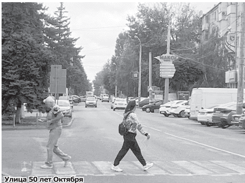
Улица 50 лет Октября

В глубине проспекта Карла Маркса расположился парк, открытый ещё в 20-е годы. Были здесь в те давние времена и деревянный летний кинотеатр, и эстрада, и танцплощадка. Появились здесь же и универмаг, и гостиница «Кавказ», и ДКЖД, нынешний Дворец культуры МГО. Это здание из стекла и бетона должно было символизировать начало постиндустриальной эпохи и стать культурным центром города.