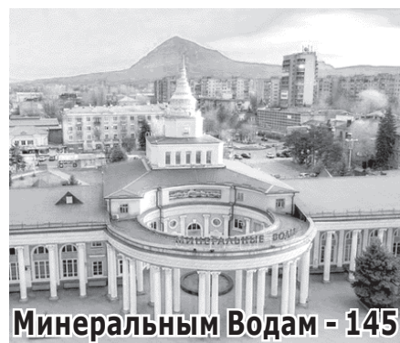
Минеральным Водам - 145