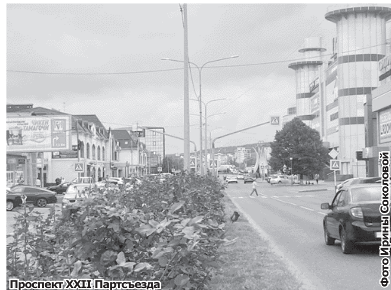
Проспект XXII Партсъезда

К 110-летию Минвод местная газета предлагала читателям перенестись на десять лет назад и взглянуть на город минувших дней: «Выходим на Привокзальную площадь. Она совсем небольшая, но уютная, зелёная. Правда, ветхие строения, среди которых