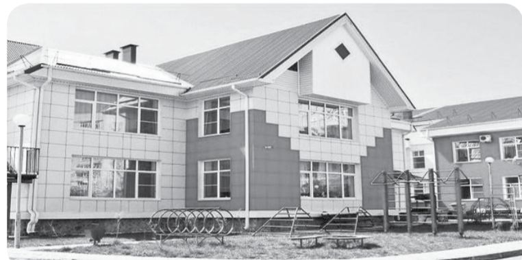
В рамках госпрограммы Ставропольского края «Развитие образования» в Минераловодском округе будут построены два новых детских сада.

Опыт опосредованного (на дистанции) обучения способствовал распространению модели обучения перевернутый класс