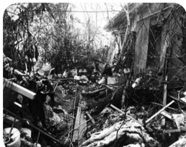
Трагедией закончилась попытка разжечь костер во дворе дома в г. Минеральные Воды.

Прокуратура Ставропольского края: 8(8652)26-38-01 Управление организации деятельности участковых уполномоченных и по делам несовершеннолетних ГУ МВД РФ по СК: 8(8652)30-44-84, 30-50-44 Уполномоченный по правам ребёнка в СК - Адаменко Светлана Викторовна, г. Ставрополь, ул. Лермонтова, 206-а, каб. 309, 310, 8(8652) 35-74-76, 35-74-40. «Телефон доверия» ГУ МВД России по СК: круглосуточно 8(8652) 95-26-26, 8-800-100-26-26 «Телефон доверия» Минераловодской межрайонной прокуратуры: 6-37-97 Телефонная линия Следственного комитета «Ребенок в опасности» 8-800-200-19-10 Отдел МВД России по МГО: дежурная часть 02 Министерство здравоохранения СК, «горячая линия» 26-78-74, 8-800-200-26-03 Единый детский Телефон доверия: 8-800-2000-122.