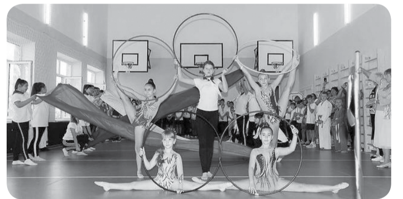
Проект «Успех каждого ребенка» позволил улучшить условия для занятий спортом минераловодским школьникам.

Сделали ограждения по периметру в школах сел Нагутское и Марьины Колодцы за 7,2 млн руб. В рамках программы энергосбережения заменили окна в школах на 7,3 млн руб. А по программе общественной безопасности в семи школах приобретены и установлены системы видеонаблюдения.