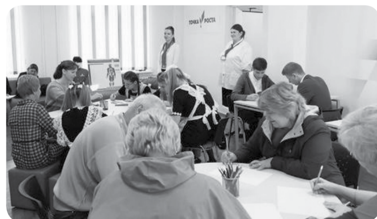
До 2023 года планируется открытие в Минераловодском округе еще 7 Центров «Точка роста» на базе сельских школ.

И результаты ЕГЭ показали, что со своей задачей педагогические коллективы справились. 2019 - 2020 учебный год 1115 наших учащихся окончили «на отлично», а еще 5085 - на «хорошо» и «отлично». Поступили в высшие учебные заведения 411 человек, из них в вузы Ставропольского края - 180 человек. Все 516 выпускников 11-х классов получили аттестаты