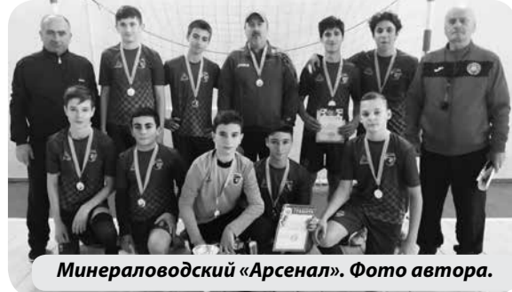
Минераловодский «Арсенал».