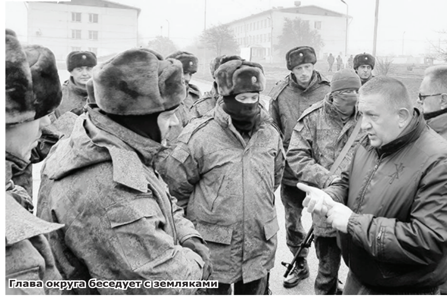
Глава округа беседует с земляками