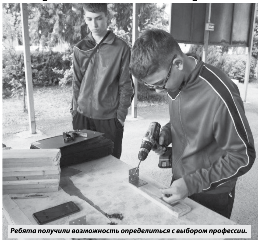
Ребята получили возможность определиться с выбором профессии.