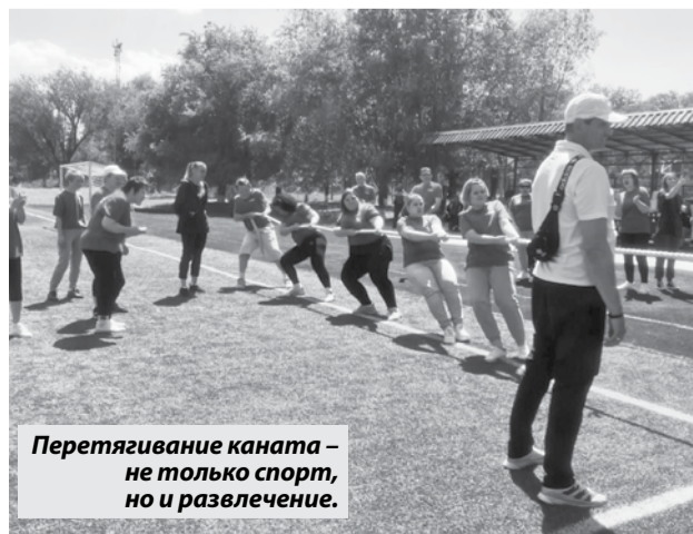
Перетягивание каната — не только спорт, но и развлечение.

На торжественном открытии присутствовала депутат Госдумы РФ Елена Бондаренко, генеральный директор государственного автономного учреждения Ставропольско-