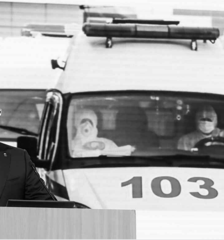
Ставрополья во время церемонии оглашения ежегодного послания.

бизнесом, пройти экспертизу в министерстве сельского хозяйства и стать обязательным для исполнения документом, – резюмировал глава Ставрополья.