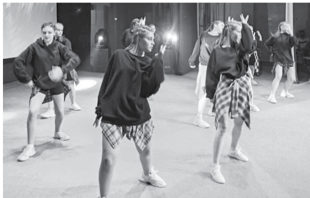
Лучшие номера для фестиваля отобрали в программах 21 ДК округа.

Лучшие вокальные, хореографические и театральные номера, отобранные на прошедшей неделе в ходе отчетных концертов 21 Дома культуры округа, были представлены на главной сцене округа.