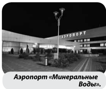
Аэропорт «Минеральные Воды».

Международный аэропорт «Минеральные Воды» в январе-июле 2022 года обслужил 2 млн 166 тыс. пассажиров, что на 25,3% больше, чем за аналогичный период прошлого года, сообщила пресс-служба предприятия.