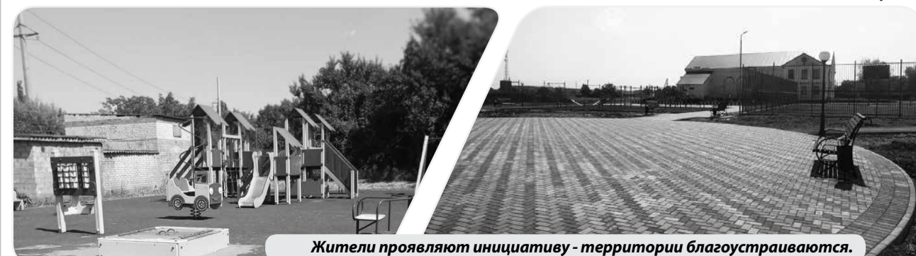
Жители проявляют инициативу - территории благоустраиваются.