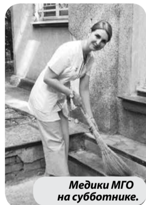
Медики МГО на субботнике.

Дружно и с хорошим настроением сотрудники убрали, мыли, чистили, красили, благоустроивали и украшали все 39 подразделений больницы. А это – стационар, три поликлиники, участковые больницы, врачебные амбулатории, ФАПы. Территории вокруг учреждений здравоохранения Минераловодского городского округа стали благоустроеннее.