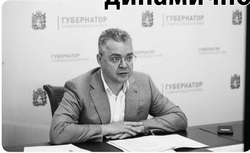
В. Владимиров: «В регионе зафиксировано летнее снижение цен на овощи «борщевого набора».

– На Ставрополье продолжает снижаться безработица. Устойчивость региональных финансов позволяет нам выполнять социальные обязательства, поддерживать предпринимательство, стимулировать экономическую активность. Поэтому сегодня всё более актуальным становится видение перспективы, поиск решений для будущего. В их числе – подготовка к предстоящему отопительному сезону, который мы впервые встретим в условиях западных санкций. Также уже сегодня необходимо готовиться к осеннему циклу сельхозработ и закладке урожая на будущий год. Все это