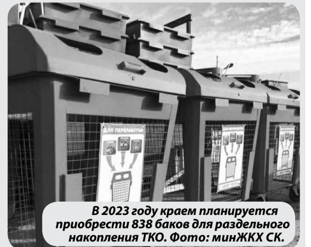
В 2023 году краем планируется приобрести 838 баков для раздельного накопления ТКО.

Напомним, в крае уже имеется порядка 2500 контейнеров, предназначенных для накопления так называемых чистых отходов. Часть из них были закуплены региональными операторами в предыдущие годы. Еще более 1,3 тысячи появились в конце 2021 года благодаря господдержке в рамках нацпроекта «Экология». Они установлены в 25 муниципальных и городских округах.