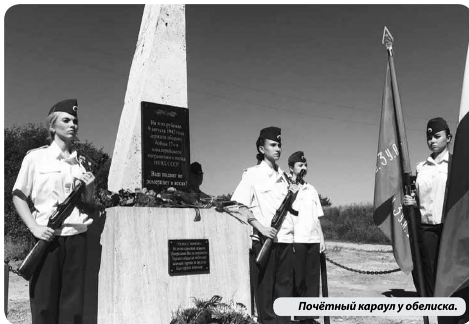
Почётный караул у обелиска.

В день 80-летия сражения бойцов 17-го кавалерийского пограничного полка с наступающими немецко-фашистскими войсками на южном берегу реки Кума в поселке Первомайском защитникам